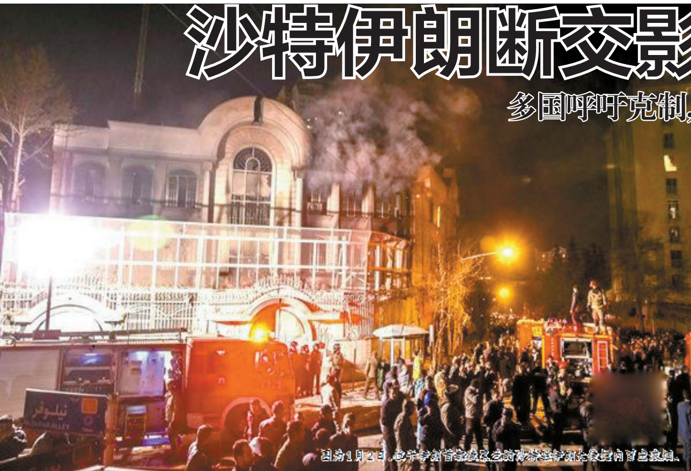
图为1月2日,也门首都萨那地区民众在沙特与伊朗断交后向自家楼顶燃放烟花。

沙特阿拉伯外交大臣朱拜尔3日宣布,沙特与伊朗断绝外交关系。受此影响,巴林、苏丹、阿拉伯联合酋长国等4日相继宣布断绝与伊朗外交关系或降低两国外交关系级别。与此同时,俄罗斯、德国、法国等纷纷呼吁沙特与伊朗保持克制,缓和双方紧张关系,通过对话解决矛盾。