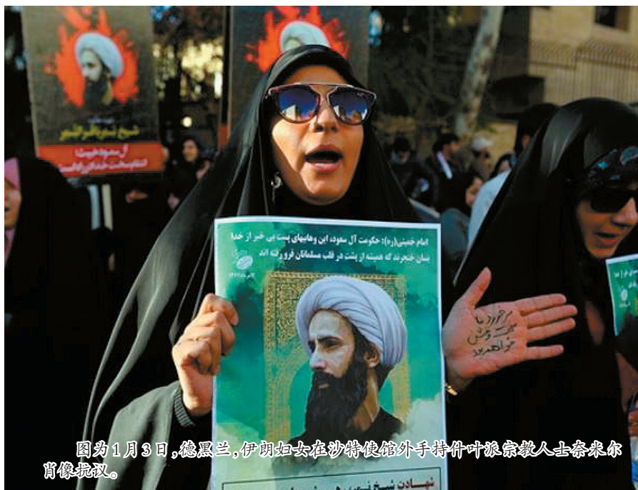
图为1月3日,德黑兰,伊朗妇女在沙特使领馆外手持什叶派宗教人士奈米尔肖像抗议。

上世纪80年代,伊朗与伊拉克爆发战争,沙特选择支持伊拉克,试图压制伊朗可能出现的对外扩张。新华国际客户端报道,1987年7月,沙特和伊朗两国紧张关系险些走向崩溃,402名朝觐人员当时在沙特麦加发生的冲突中丧生,其中包括275名伊朗人。在伊朗首都德黑兰,民众走上大街抗议,冲击沙特大使馆,并火烧科威特大使馆,有一名沙特外交官丧生。