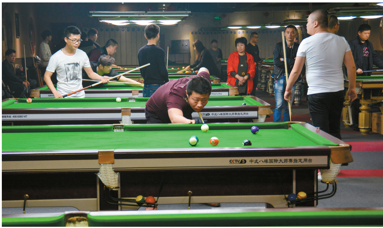
4月9日下午,由市教育局主办、市台球协会承办的克鲁斯堡杯——中式八球公开赛在市区邮电巷举行,吸引了众多台球爱好者报名参赛。