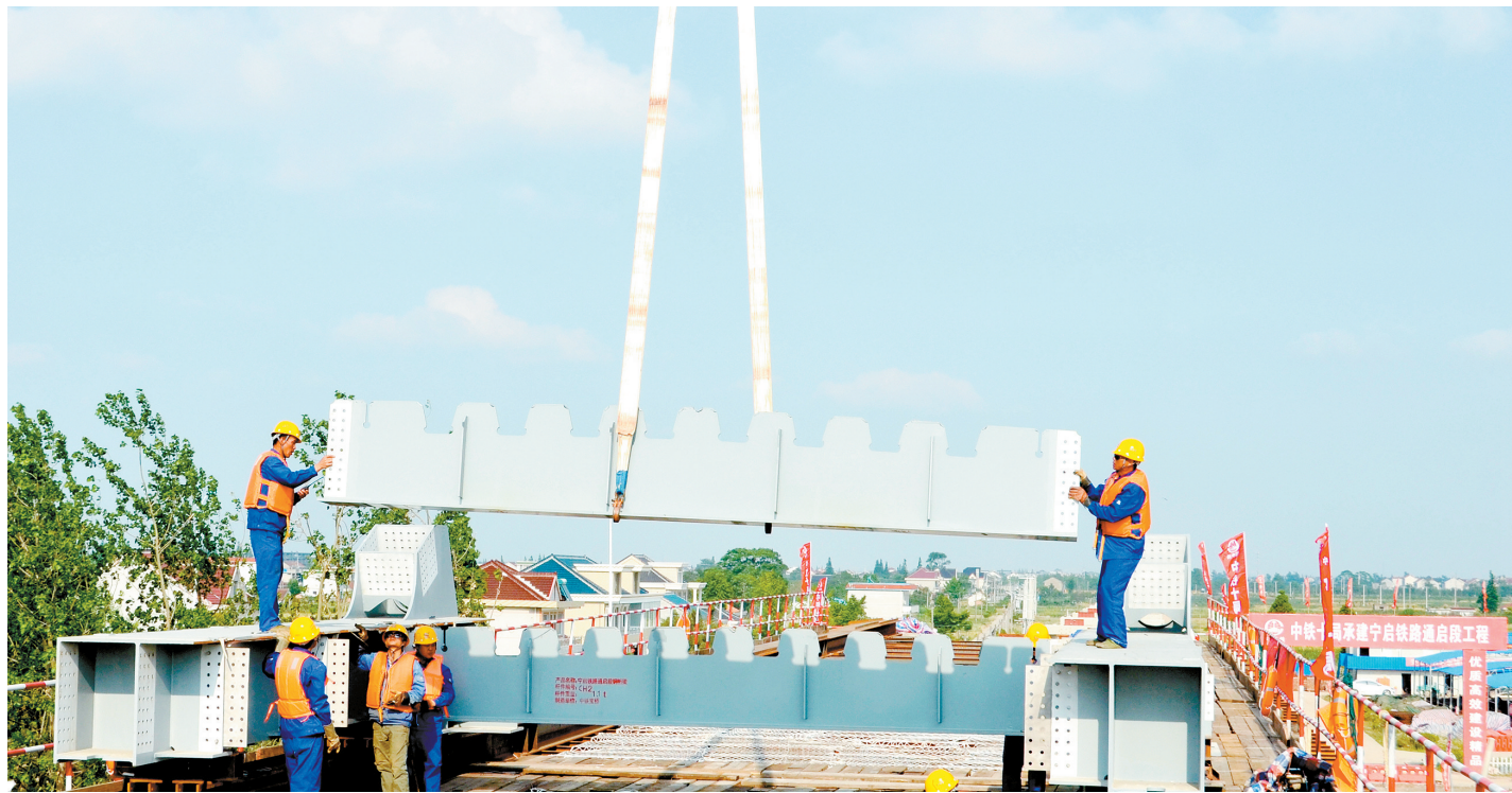
位于王鲍镇的宁启铁路通启段新三和港特大桥，全长2.046公里，桥下部结构工程已基本结束，正在进行钢桁梁拼装施工。目前，钢桁梁拼装工程已完成50%，计划于6月25日全部结束。图为中铁十局工人正在紧张作业。

三是过程监督，实现精准化考评。局纪委通过不定期抽查、年中分批检查、年底集中考查，对基层单位《履职纪实手册》进行督促检查，并将其作为考核履行主体责任和监督责任情况的重要依据。对检查中发现的履责不记录、记录不规范、责任落实到位等问题及时提醒，将两个责任的担子层层向下压实。（方凯成 施娟）