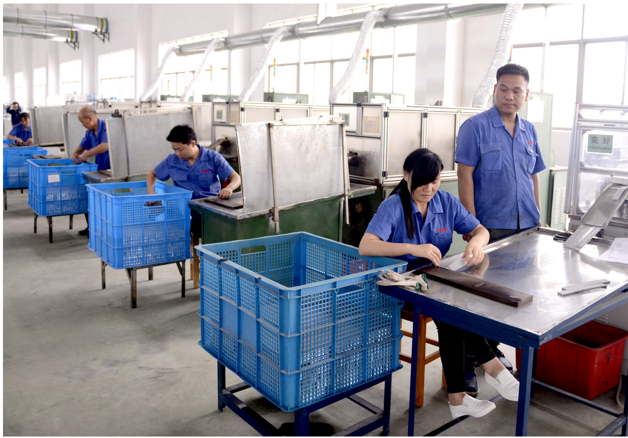
7月5日,江苏优萌热交换系统有限公司重型装备发动机热交换系统制造车间内,工人紧张生产。该项目位于滨海工业园,总投资1.5亿元,主要生产轮船、货车、重型装备发动机热交换系统及其零配件。目前,该项目配套设施建设已完成,开始试生产。全部达产后,预计可实现年销售额2亿元。

社区党总支书记围绕“两学一做”这一主题,深入浅出地解读了习近平总书记系列重要讲话精神,每位党员结合各自的工作实际,畅谈自己的学习体会。(陆爱辉)