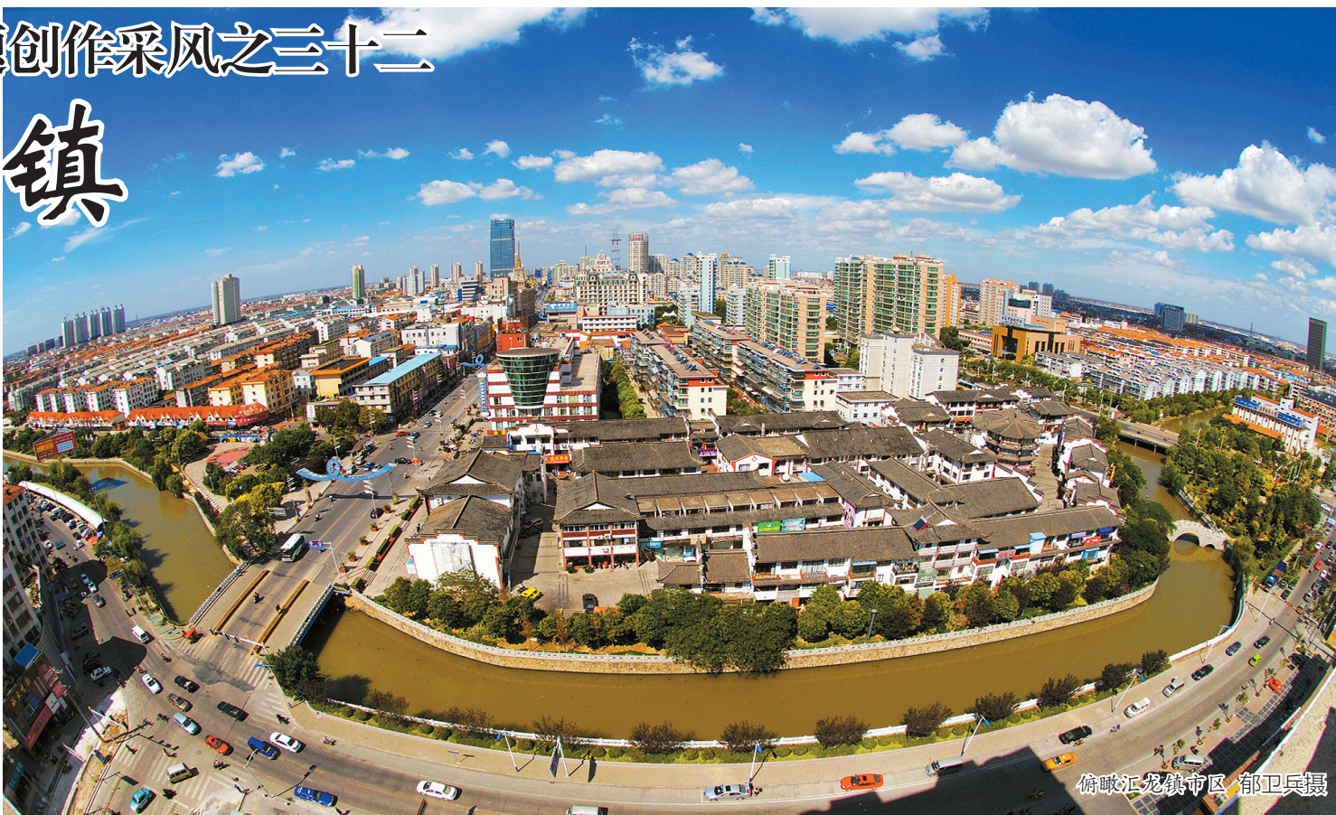
俯瞰汇龙镇市区