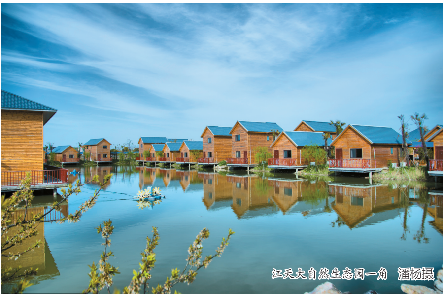
江天大自然生态园一角