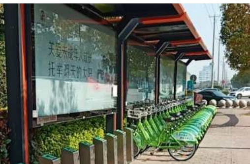
融媒体记者 陈天灵

7月16日上午,在药明康德公司门口的公共自行车站点,王女士告诉记者:“我之前上班都是骑电瓶车的,自从这里有了公共自行车站点后,我每天上下班都骑自行车,既锻炼又环保。”