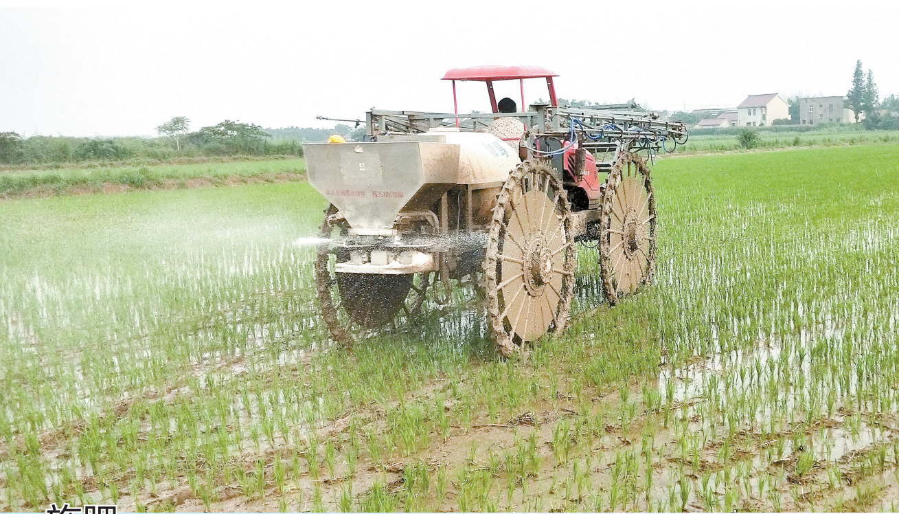
施肥 促增收 日前,北新镇轱昌村一连云港外来种植户正在稻田施分蘖肥。据了解,我市今年共种植水稻75000亩,比去年增加5000多亩,品种主要以南梗5055为主。眼下正是水稻返青、分蘖期,稻农们抢抓农时普施分蘖肥。

社区符合条件的24名适龄青年积极参与应征报名,并全员参加了小体检,大家纷纷表示要随时准备接受祖国挑选,保家卫国。(王慧)