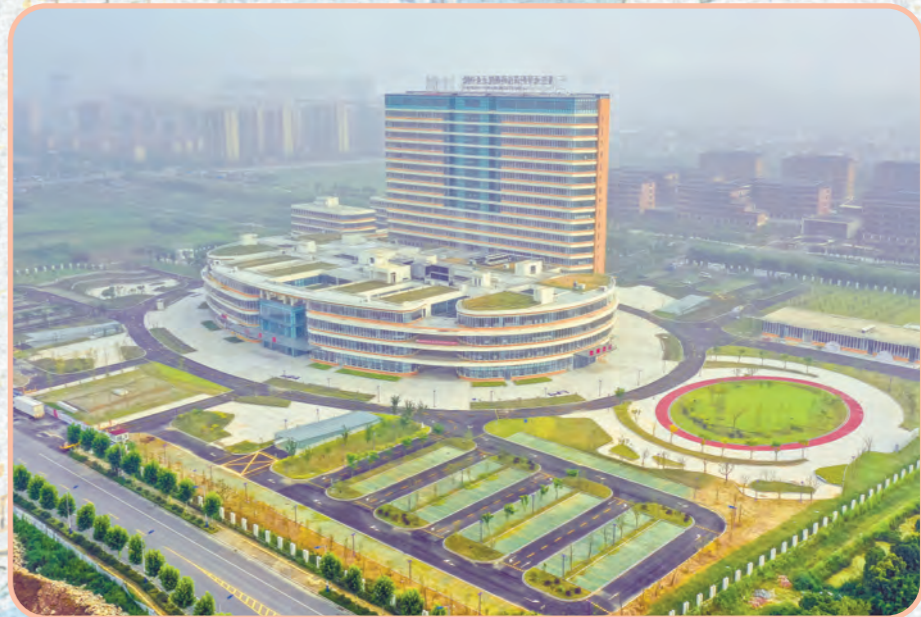
启东市妇幼保健院正式启用。

2020年,启东十大类民生实事项目扎实推进,民生支出95亿元。在全省率先完成幼儿园园舍全区域、全覆盖改造建设;市妇幼保健院与复旦大学附属儿科医院合作办院,在全省率先完成“所转院”;启东保利大剧院高品质运营,文化馆新馆正式启用,“共乐东疆”文体活动广泛开展。