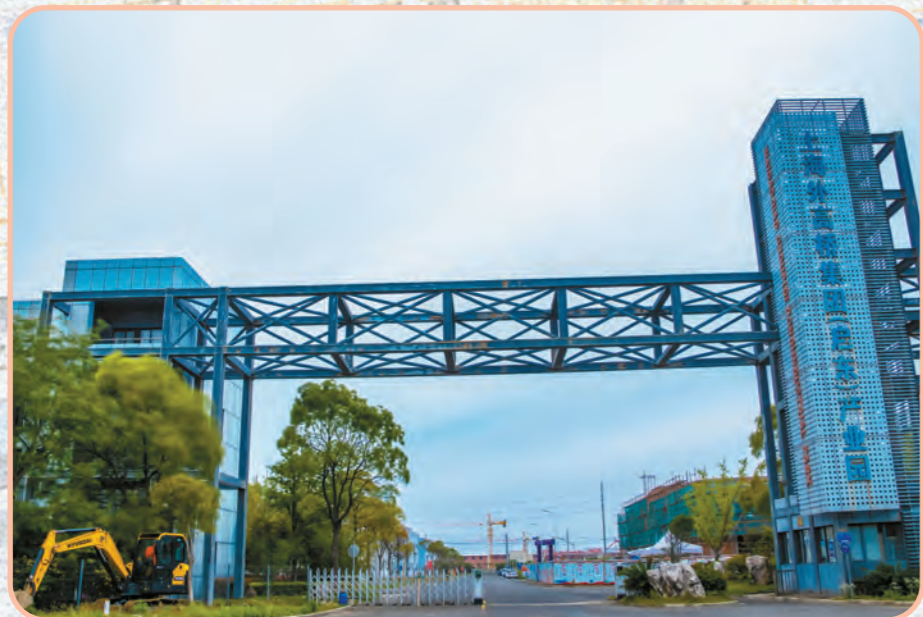
上海外高桥集团(启东)产业园“引凤来栖”。

2020年,我市放大区位优势,深化全方位对接,稳步推进深入对接浦东三年行动计划,全力跑好对接浦东“第一棒”,成立启东对接上海(浦东)联络办,把启东与上海两地的人才、资金、项目等要素紧密联系起来;在浦东张江成立上海招商分局,全面对接浦东“中国芯”“创新药”“智能制造”等六大硬核产业;新建东江生物医药产业园、半导体装备及材料产业基地,启东配套浦东产业园三个对接上海特色产业园区。