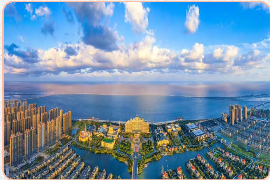
“启东蓝”刷出幸福感。

2020年,我市坚定不移修复长江生态,加快滨江森林公园、沿江生态绿带建设,从而在长江北岸绘就70公里最美江景。与此同时,通过统筹推进沿海生态岸线修复、岸堤道路提升、沿线景观打造,创建临海景观、特色片区,串起108公里最美海滨,建设178公里最美江海观光通道,打造“北纬32度最美江海岸线”,魅力“蓝湾”未来可期。