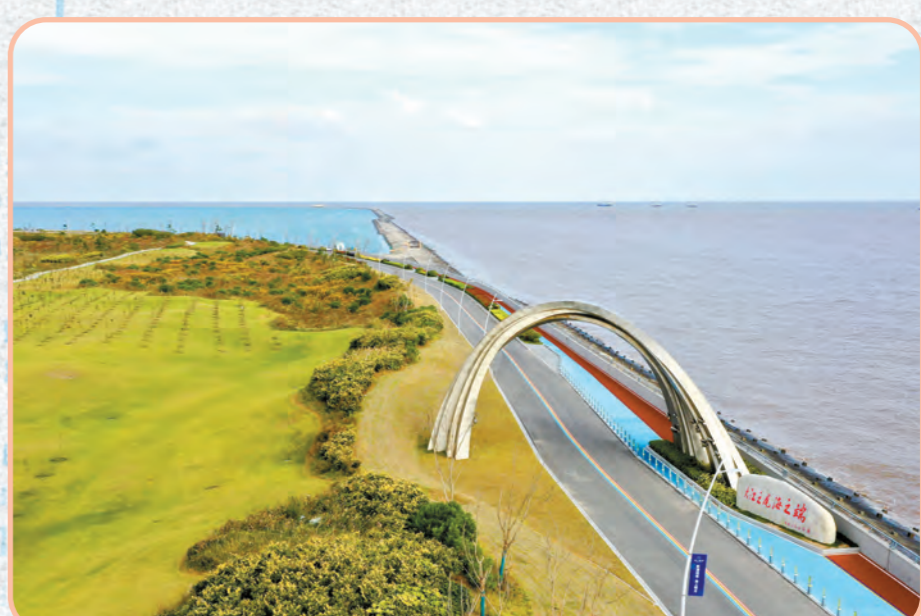
全力打造最美江海岸线。