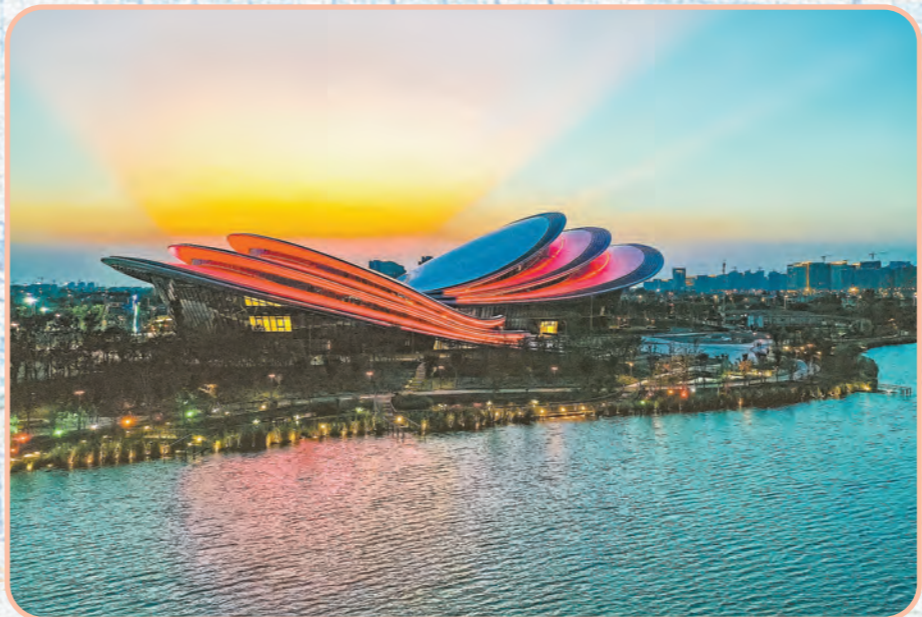
螺湖美景入画来。

2020年,我市扎实推进城市建设三个“十大工程”。螺湖片区功能品质不断提升,金融建筑产业园主体工程结构封顶;生命健康科技城一期、二期即将完工,规划展示馆建成开放;新增城市绿地70万平方米、成片林近6000亩。城乡生活垃圾无害化处理率达100%,我市蝉联国家卫生城市。