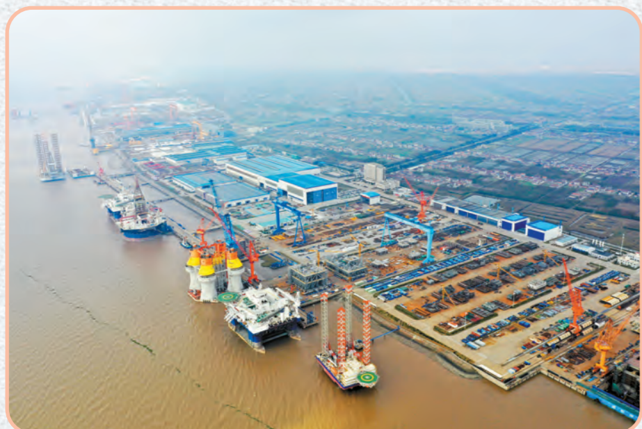
造型各异的船舶海工产品矗立于海工船舶工业园沿江码头。

2020年,我市全年预计(下同)地区生产总值达1230亿元;完成一般公共预算收入72亿元;完成规模工业产值840亿元;高新技术产业产值占规模工业产值比重达54.3%,列南通第二。完成工业应税销售910亿元,增长15%,增幅列南通前三;服务业应税销售700亿元,增长40%,增幅列南通第一。实际利用外资3.4亿美元,增长11.8%,增幅列南通第二。大力开展“消费促进月”等活动,实现社会消费品零售总额420亿元,增长2.3%,增幅列南通第一。