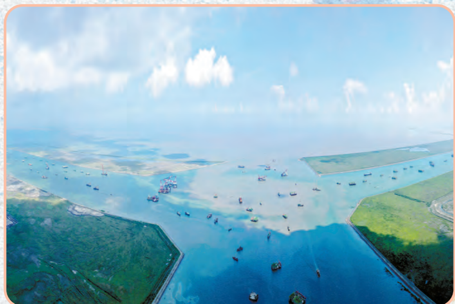
加快建设吕四起步港区“2+2”码头。

2020年6月29日,通州湾新出海口吕四起步港区“2+2”码头开工建设,建设内容包括4个10万吨级通用泊位(2个预留集装箱功能)及后方陆域配套工程。按照建设世界一流港口目标,以自动化、智能化标准进行建设,同时还将建设内河转运区、内河航道、疏港铁路、疏港公路等配套工程,实现“公铁水、江海河”无缝衔接的集疏运体系。计划2021年底建成投运,实现新出海口开港。该项目是南通建设一带一路对外开放新门户、长江经济带江海联运新枢纽、长三角高质量发展新样板的重大标志性项目。