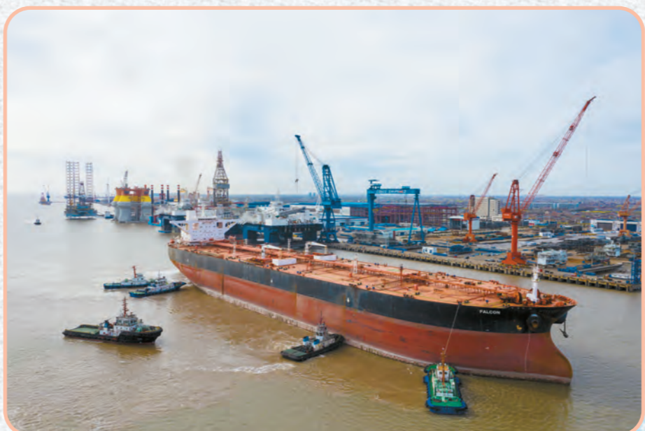
“猎鹰”轮成功停靠启东沿江码头。

2020年3月16日,30万吨超大型油轮船体“猎鹰”轮成功停靠在长江口北支航道,这是该航道通航以来靠泊的吨位最大的船舶,也是启东中远海运海洋工程有限公司复工复产后承接的首个浮式生产储卸油船。此次成功靠泊,为长江北支航道大型船舶通航开创了先例,对于稳定航道河势,分流减轻南支主航道压力,满足沿线临港产业发展需求等方面都具有十分重要的意义,同时也为启东制造更多的“大国重器”开辟新的航道。