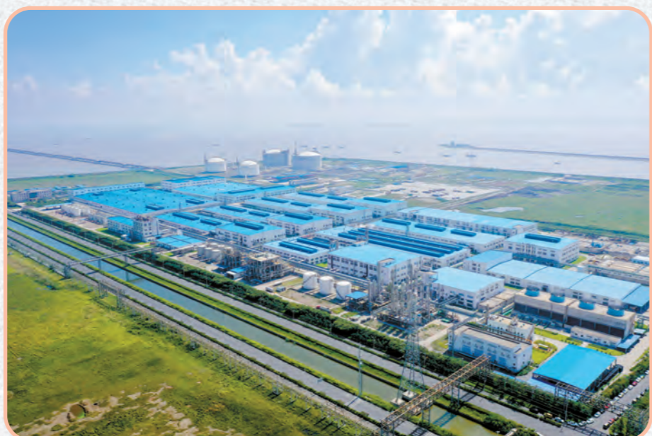
航拍镜头下已投产的江苏华峰超纤材料有限公司一期超纤一体化项目。

2020年,全市上下牢固树立“大抓项目、抓大项目”的导向,持续掀起“大项目突破年”活动热潮,项目建设考核争先进位,百亿级项目有力突破。新签约注册亿元以上项目80个,其中华峰可降解塑料、益海嘉里等百亿级项目2个;新开工亿元以上项目100个,其中中华峰超纤新材料、海上风电等百亿级项目2个。