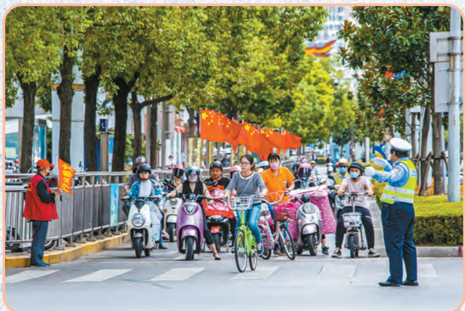
道路交通秩序井然。

2020年11月,我市以全国第七、全省第二、南通第一的佳绩创成第六届全国文明城市。近年来,我市始终坚持创建为民、创建惠民、创建成果人人共享,始终把创建全国文明城市放在市委市政府全局和战略的高度来把握和推进。在全市上下坚持不懈的努力下,城乡环境面貌、城市管理水平、市民文明素养得到全面提升。