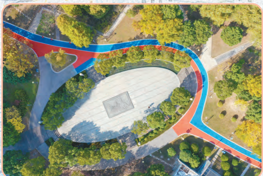
头兴港河畔,儿童乐园景色怡人。