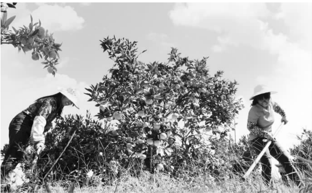
连日来,湖山乡龙珠岗柑桔场里,工人忙着铺设薄膜,以增加阳光反射度,确保柑桔品质。龙珠岗柑桔场一直坚持无公害栽培,不使用化肥农药,柑桔品质深受市场青睐,目前,龙珠岗柑桔场已成为丽水市优质高效农产品示范基地。