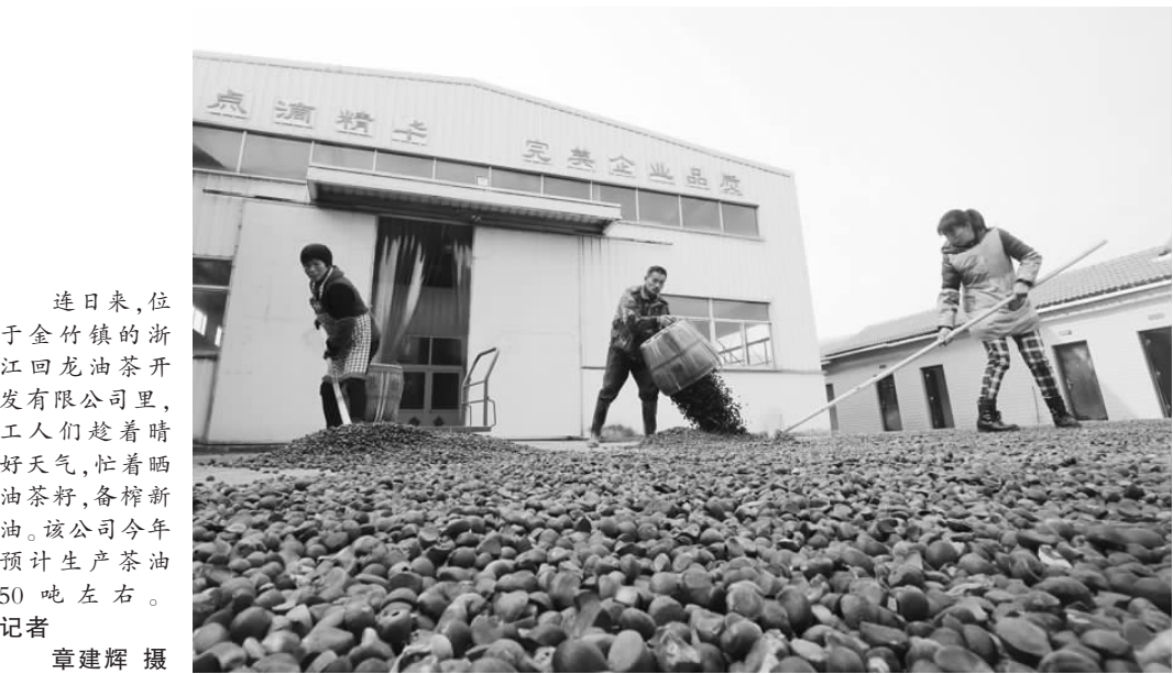
连日来，位于金竹镇的浙江回龙油茶开发有限公司里，工人们趁着晴好天气，忙着晒油茶籽，备榨新油。该公司今年预计生产茶油 50 吨左右。

科毕业生，他们分布在各行各业，为地方经济社会发展作出了积极贡献。 会上，来自浙江电大的专家围绕现代远程教育建设，结合自身工作实际，作题为《走向一种全新的后现代思维方式》的学术讲座，为全市电大下阶段如何开展远程教育办学提供了借鉴，受到了与会人员的欢迎。 期间，与会人员还考察了我县农村电子商务中心。