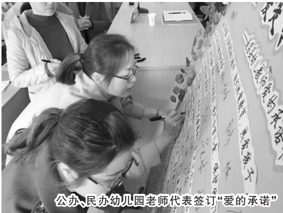
公办、民办幼儿园老师代表签订“爱的承诺”

“我们会组织校园保安们在暑期参加封闭式培训,进一步增强他们的安全意识、责任意识和实战意识。”