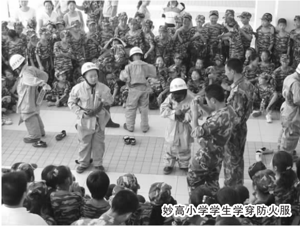
妙高小学学生学穿防火服

孩子高高兴兴上学、平平安安回家,是每一位家长朴实的心声,也是每一位教育工作者的心愿,更是每一所学校常抓不懈的重点工作。多年来,我县坚持以深化校园安全工作为抓手,做到校园安全检查常态化、安全教育特色化、安保举措多元化,确保了师生平安和校园稳定,为全县教育事业持续稳定发展和平安遂昌建设夯实了安全基础。