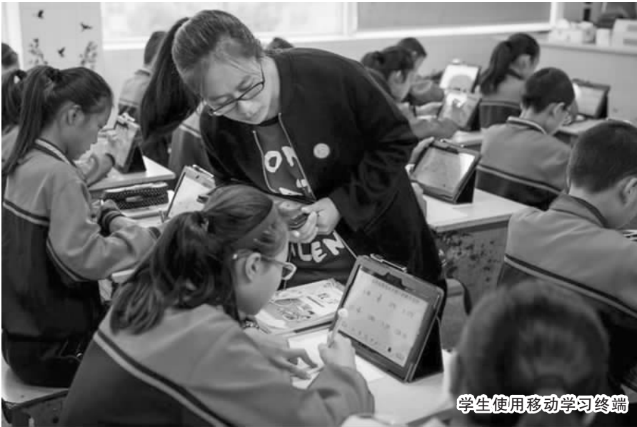
学生使用移动学习终端

开卷有益,必有所获。一个崇尚读书的社会必定是充满希望的社会,而一个崇尚读书的校园必定是健康而充满生机的校园。 规格一致的书架、分类明确的图书、整洁宽敞的阅览室、安静有序的阅读环境……立足“书香校园”工程建设,我县实现了校校有图书馆(室)、班班有图书角,“书香校园”氛围日趋浓厚,学校品位得到了较大提升。 据介绍,在省书香校园工程的助力下,仅 2014 年至 2016 年间,县财政便专项投入 170