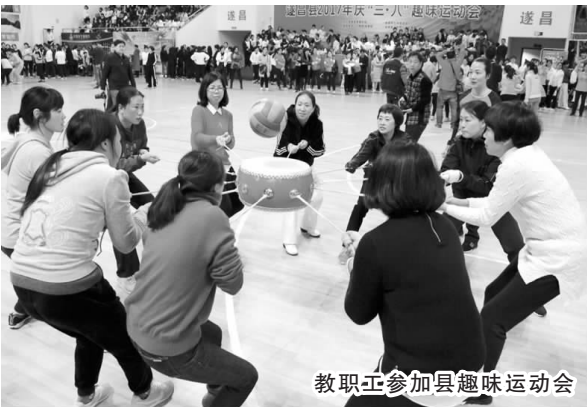
教职工参加县趣味运动会