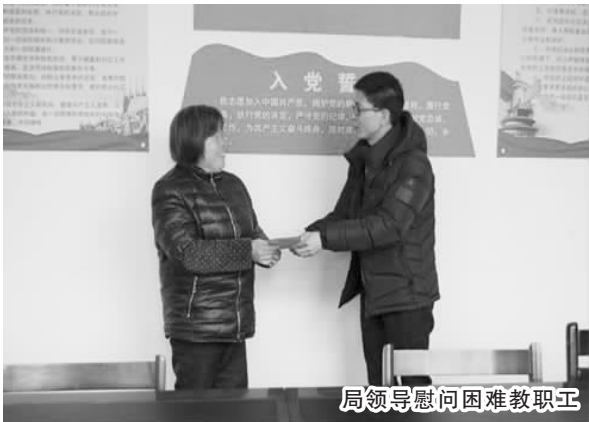
局领导慰问困难教职工

“围绕当前课程改革、义务教育均衡发展等中心工作,我们还组织开展了教职工粉笔字、钢笔字等教师基本功系列赛等活动。”县教育工会相关负责人告诉记者,通过此类活动的开展,能够引导教职工树立新的教育观念,掌握先进的教学方法,提高他们的教学水平和技能。