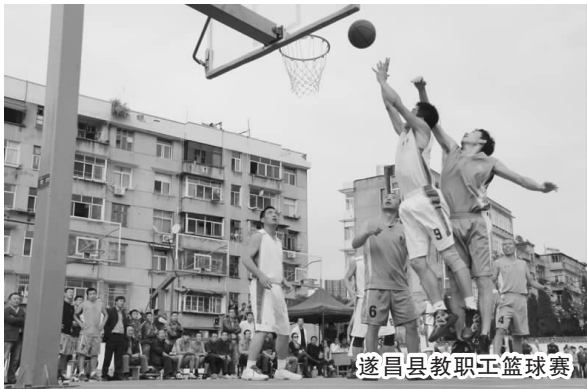
遂昌县教职工篮球赛

摊上难事怎么办?遇到困难怎么办?无论是遭遇工作还是生活上的问题,我县教职工队伍总是第一时间不约而同地想到“娘家人”——县教育工会。而这份沉甸甸的信赖,正是多年来县教育工会心系职工群众、积极担当作为所带来的最好回报。