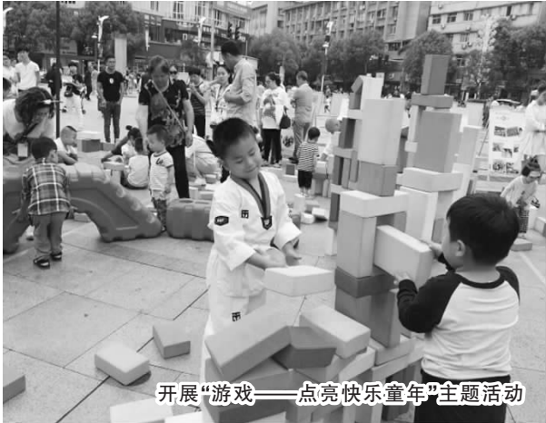
开展“游戏——点亮快乐童年”主题活动