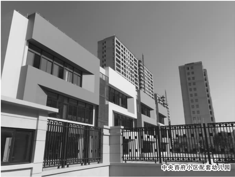
中央首府小区配套幼儿园

人生百年,立于幼学。作为国家的未来与希望,如何办好学前教育,筑牢孩子们的“起跑线”,是建设完善国民教育体系中的重要课题之一。