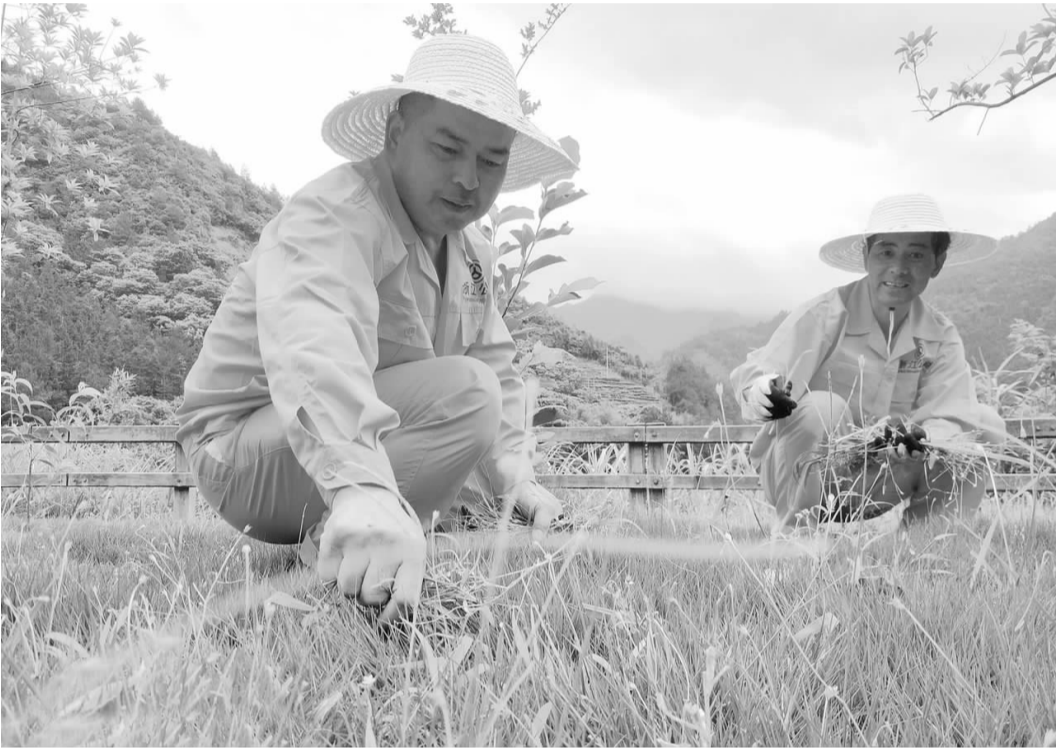
5月26日,县公路养护公司党支部开展“5·26 爱路日”暨“我爱路,我文明,我行动”主题党日,该活动以倡导爱护公路、文明上路为主题,将公路文化融入党建工作,创新推广公路文化品牌,积极营造知路、爱路、护路的良好氛围。

截至目前,我县已开设“山海协作”名师班、青年干部班和新苗班,培训学员近 270 名,下步还将开设骨干校长班和骨干教师班。