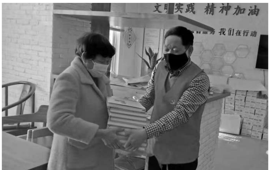
1月12日至14日，县档案馆开展送书下乡活动，将近年来编纂的《遂昌年鉴》等书籍送到各乡镇（街道）、村，实现党史和地方志书籍县、乡、村全覆盖，促进基层干部和群众深入了解党史和县情。