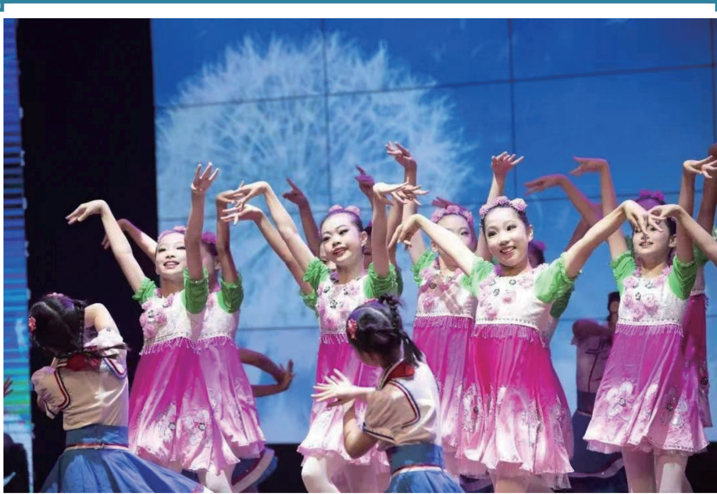
清河湾学生舞蹈团首次亮相

一段时间以来，青浦图书馆深入了解老人们的精神需求，给老人们提供“电话咨询”、“代借还图书”、“送书上门”等免费服务，贴心适老人群。（朴读）