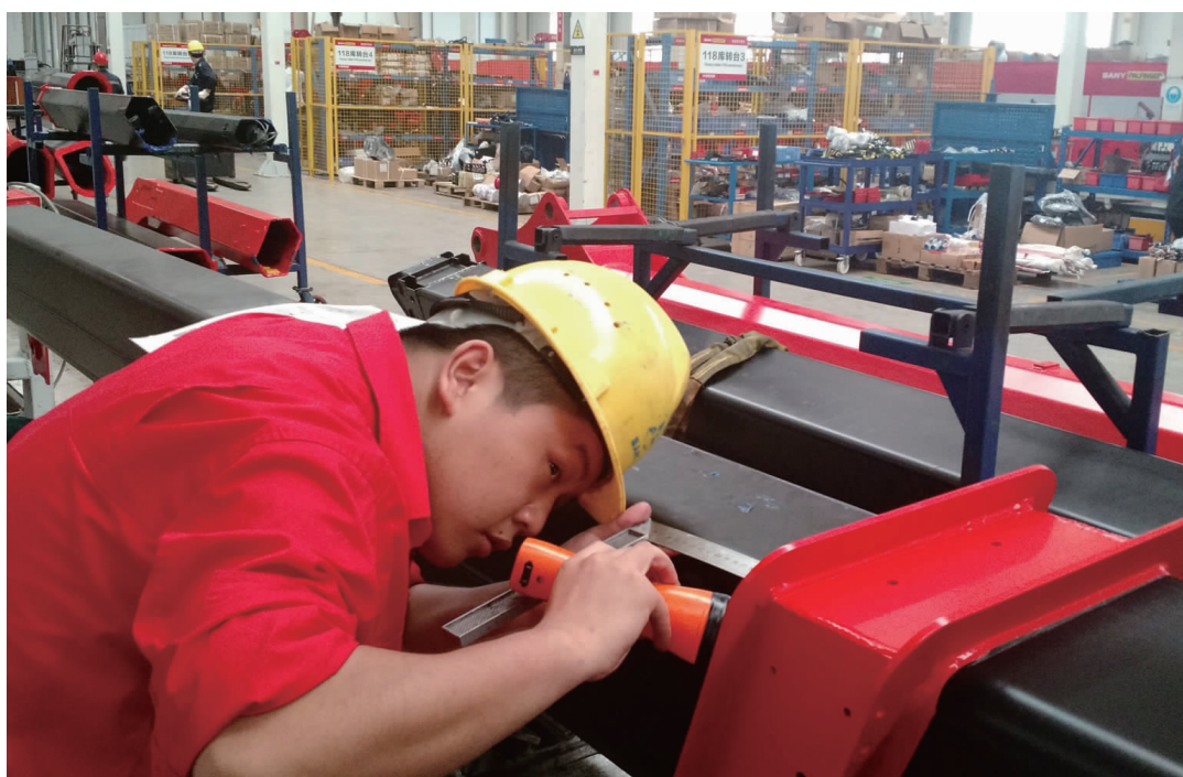
昨天,三一帕尔菲特特种车辆有限公司车间内,技术工正在检查吊机大臂装配。该公司的直臂吊特种机械手,最重可以吊起14吨的重物,如果手臂延伸出18米开外,也能吊起重物1.5吨,领先世界同类生产企业。今年以来,公司每个月生产线上产出约100台特种机械车辆,计划到2018年实现产能1万台,实现年产值30亿元。

作为光电线缆行业的领军企业,集团长期以来秉承“精细制造”的文化理念,实施差异化竞争战略,在特种产品上做文章,在创新创优上下功夫,不盲目扩大规模,而注重做优做强,扎扎实实练好内功,人均利润率创业内最佳。近几年来,中天科技集团科技创新成果斐然,自主研发研制的一系列高端产品广泛应用于国内外重大项目;特种电力光缆市场占有率连续多年全球第一;柔性直流海缆成功投运世界首个电压等级最高的厦门直流输电示范工程,实现从±160千伏——±200千伏——±320千伏的三级跨越;在光通信、无线通信、轨道交通通信、海洋通信等领域均取得令人瞩目的成绩。