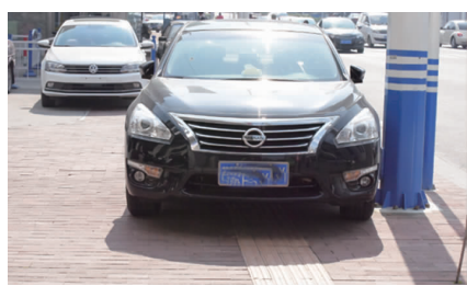
广隆路口,私家车占用盲道停车。