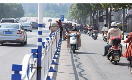
逆向行驶,危险!