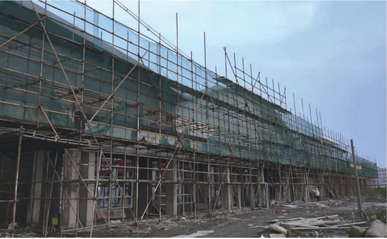
位于沿海经济开发区的江苏优嘉植物保护有限公司优嘉花苑商务研发中心项目,总投资近 1.8 亿元,主要建设植保研发中心、培训中心、商务中心、体育休闲中心及构建相关配套设施、设施等,总建筑面积为 45074 平方米。据悉,工程将于今年底基本竣工。

接下来,沿海经济开发区将以创 建国家新型工业化产业示范基地、国家 卫生镇、国家级旅游度假区为抓手, 以项目建设为重点,冲刺四季度这一 项目建设的黄金期。加快打造千亿级 产业板块,建设国际化沿海新城,确保 全年完成亿元工业项目 18 个、服务业 项目 10 个。