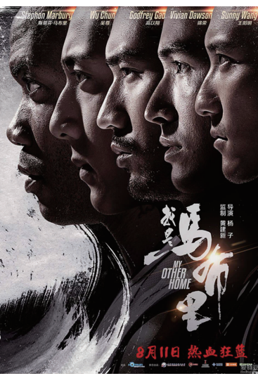
史，会对那些精神萎靡、生活充满疲态的年轻人，带来鼓舞作用；二是强调集体团结的力量，也就是我们常说的“众志成城”。

如果说影片藏了那么一点批判的精神，那么很容易发现它的批判矛头指向哪里——不用辩白，影片所指出的团队内耗、集体不上进、各自为战的情况，并非只在故事里的篮球队中存在，在其他单位、组织或公司、企业中，也有不同程度的存在。就这点看，把《我是马布里》当成一部有利于“团建”的电影看也挺合适的。