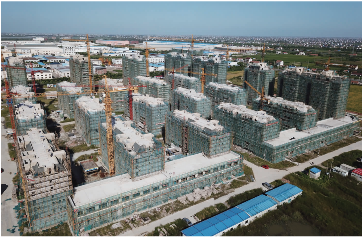
如东经济开发区安置房四期建设项目总投资2.2亿元,住宅楼22栋,共计554户,占地面积约73805.25平方米,商业面积约7872.16平方米,目前主体工程已结束,正在进行室内外装修,计划今年年底竣工。

三年半的时间,公司发生了翻天覆地的变化。一期项目对老生产线全部改造,实现产能翻倍;二期投入7500