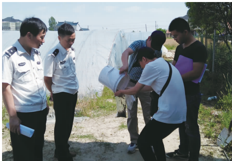
县渔政大队工作人员现场抽样检查

近年来,我县把水产品质量安全作为关系到消费者身体健康、社会稳定和产业发展的大事来抓,取得了显著成效。在连续多年的部、省、市水产品质量监督抽检中,如东产品的抽检合格率一直保持在100%以上,全县未发生过涉及水产品的食品质量安全事件。