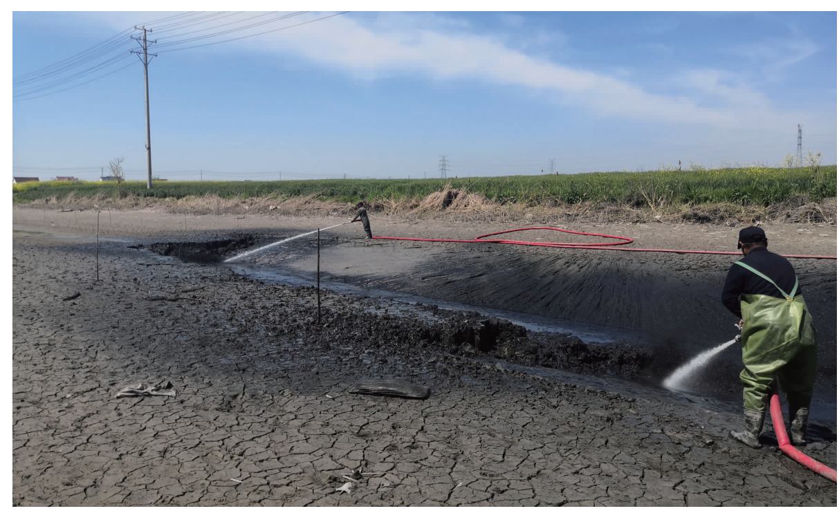
为深入贯彻落实乡村振兴战略及《农村人居环境整治三年行动方案》,市、县计划三年对农村河道疏浚整治,今年是整治的第二年。丰利镇计划今年整治河道89条,总长度107.82公里,涉及20个村居,预计投资近700万元。图为工人正在整治丰利镇环港垦区南北中心河。

(上紧接第一版) 借助全县开展“清水绿岸”提质行动工作之势,顺应生态发展潮流之势,趁着各级环境集中整治持久攻坚之势,坚持问题导向、目标导向、责任导向,有序有效开展河道治理;因河制宜抓整治,摸实摸准每条河道情况,针对实际问题采取对策,做到一河一策、有的放矢;溯源体检抓整治,重点解决河道脏乱差问题,加快控源截污,针对河道污染源对症下药,突出统筹上下游、左右岸、干支流、水陆关系,实行综合治理;精准施策抓整治,抓好重点指标、重点环节、重点区域整治,注重河道整治质量和标准,做到标本兼治、综合整治;示范引领抓整治,着力抓好“五个一”工作,即紧盯一个任务清单、展现一批工作典型、各镇区新打造一个撤并老镇区示范点、新打造一个示范点、各村新打造一条示范河;有效联动抓整治,加强镇区和部门整体联动,密切河长、人大代表、群众之间的协同配合,推进生产、生活、生态修复一体化治理,畅通治水渠道,推动水环境质量持续改善。