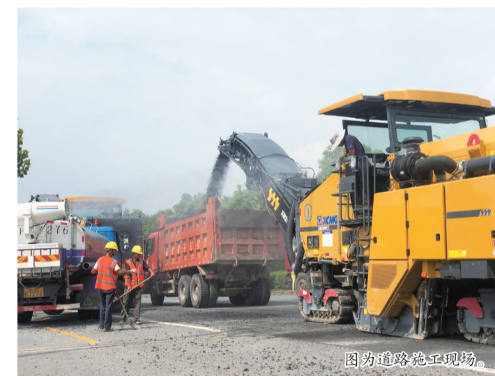
▲图为道路施工现场。

本报讯(全媒体记者 陈慧 李晨逸)11日,我县又迎来35℃的高温天气,记者来到228国道如东段养护大中修工程项目的工地现场,铁刨机、运料车、洒水车来回穿梭,机器运转产生的高温和炎热的天气交织,让施工环境更加炙热难耐,工人们不畏酷暑,依旧奋战在道路建设一线,抢抓修路时机,确保道路建设工作顺利推进。