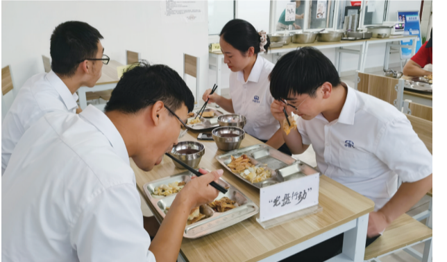
近日,中铁七局郑州公司如东电缆隧道项目部开展“光盘行动”主题活动,晒光盘传递正能量,积极宣传文明知识,倡导文明餐桌行为,把文明节俭之风落实到日常工作生活中。

本地莲藕即将进入采摘期,8月以来,种植户陆续开始最后一次施肥。据了解,我县莲藕大面积种植于马塘镇、岔河镇、城中街道等地,种植品种不一。受气温和雨水影响,今年莲藕预计减产20%左右,但由于产量降低,价格比往年上涨了10%至20%。