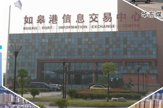
如皋港信息交易中心