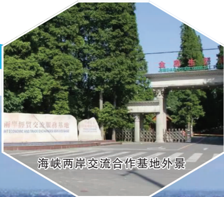
海峡两岸交流合作基地外景