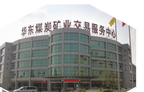
华东煤炭矿业交易服务中心

新时代开启新征程,新使命呼唤新作为。长江镇始终高举习近平新时代中国特色社会主义思想伟大旗帜,在市委、市政府的坚强领导下,大力弘扬治沙精神,瞄准“城市副中心”定位,最大限度发挥好如皋港转型发展和现代物流产业发展“主阵地”作用,大力实施先进制造业与现代服务业“双轮驱动”战略,统筹抓好深度开发与生态保护,坚持功能、生态、产业、建设并举,在精准发力中促进经济高质量发展,奋力走在全市高质量发展最前列。