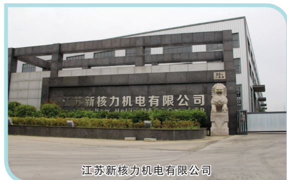
江苏新核力机电有限公司