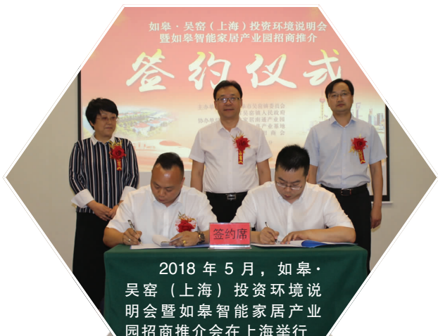
2018年5月, 如皋·吴窑(上海)投资环境说明会暨智能家居产业园招商推介会在上海举行

吴窑镇, 总面积64平方公里, 下辖17个村(社区), 常住人口6.8万人, 处长江北岸, 与上海、无锡、苏州隔江相望, 舒适宜人、和谐包容、淳朴厚善, 依旧延续着千年来的福寿风情, 是闻名遐迩的“建筑之乡”“长寿之乡”“山羊之乡”和“银杏之乡”, 是国家环境优美乡镇、江苏省重点中心镇、江苏省文明镇、江苏省卫生镇。近年来, 吴窑镇抢抓对接上海发展机遇, 形成以建筑业、智能家居业、先进制造业为主导的“三园一城”产业格局。