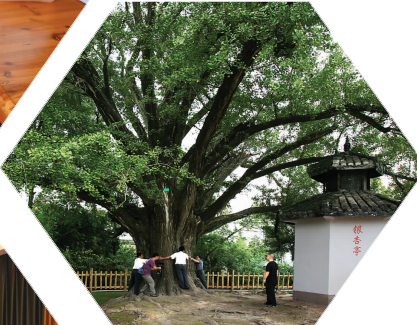
1300多年的“银杏王”依然苍劲挺拔