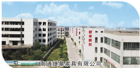
南通捷皋家具有限公司