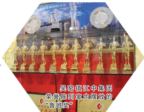
吴窑镇江中集团荣誉陈列室内摆放的“鲁班奖”

吴窑镇南衔接宁通高速公路和沿江一级公路, 新204国道和如港一级公路穿镇而过, 距如皋港出口、九华高速出口及皋张汽渡10分钟车程, 30分钟可到达江阴长江大桥、苏通大桥、南通兴东机场, 1.5小时可到达上海。南有如皋、南通两个长江深水港, 距离建设中的沪通城际高铁南通西站仅15公里。作为长江北岸的重要枢纽, 吴窑镇正全面迈进“高铁时代”, 以其独有的优势, 积极接轨苏南, 紧抓发展机遇。