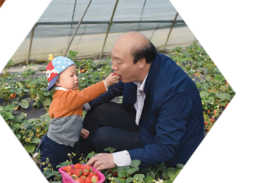
素有“甜果之乡”美誉的九华镇, 吸引南通及周边市民周末、节假日前来采摘甜果, 体验农家生活