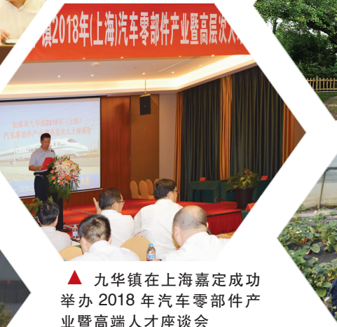
九华镇在上海嘉定成功举办2018年汽车零部件产业暨高端人才座谈会