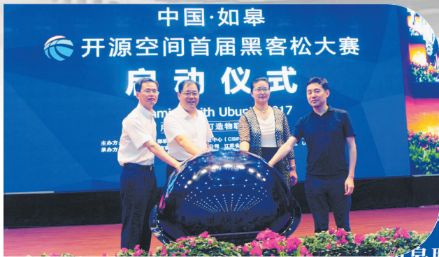
中国·如皋开源空间首届黑客松大赛

科技金融融合初见成效。 一是制定了科技金融操作细则和规程。先后制定完善了《“苏科贷”工作操作细则》《省科技成果转化风险补偿专项资金不良贷款风险补偿操作规程》，建立了动态企业库。至 2017 年末，全市 45 家企业获得“苏科贷”2.07 亿元，25 家企业获得“如科贷”1.37 亿元，有效缓解了科技型企业融资困难。二是搭建了科技贷款合作服务平台。多次组织召开全市科技金融洽谈会、银政企联席会等，统筹全市科技金融资源、优选优育科技企业资源，加强科技企业与金融部门之间的协调互动，积极搭建银企合作平台。三是完善了科技金融服务体系。立足为科技型企业提供更加便利的科技金融服务，市政府出台了《关于促进科技金融创新扶持科技型中小企业发展的若干措施（试行）》文件。2016 年 10 月引进了南通科技担保公司并成立了如皋分公司，当年完成担保放贷 1600 万元，出具担保意向书 1400 万元。