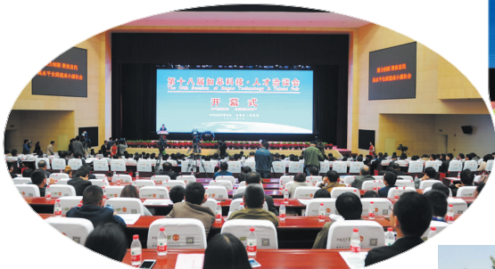
第十八届如皋科技·人才洽谈会