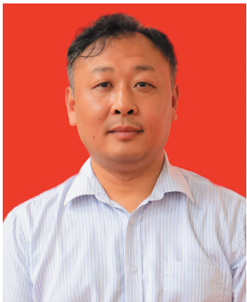
市科技局党组书记、局长 马军华

党的“十八大”以来，我市深入推进供给侧结构性改革，全面实施创新驱动发展战略，推进大众创业、万众创新深入发展。通过加强各类创新载体建设，加速科技成果