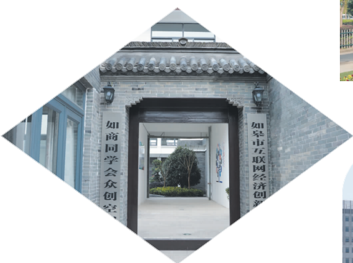
如商同学会众创空间