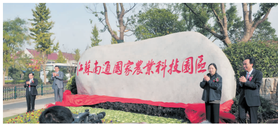
江苏南通国家农业科技园区