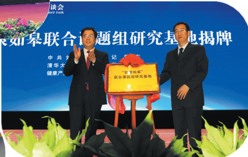
“健康如皋”联合课题组研究基地成立