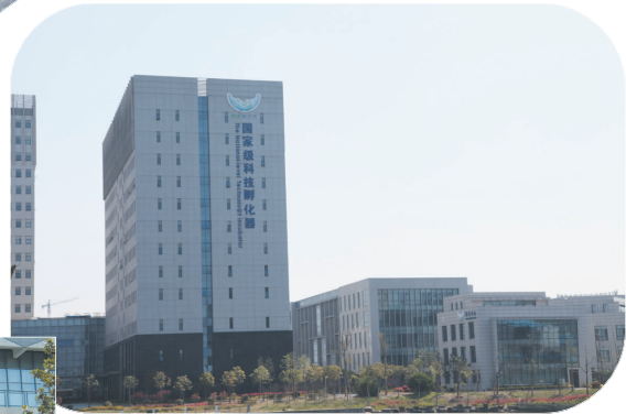
国家级科技企业孵化器——如皋软件园