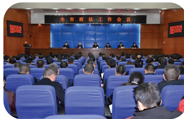
2018年3月6日全市政法工作会议召开

三是加强统筹推进。市委、市政府和各镇（区、街道）党委、政府将公众安全感、法治建设满意度、政法队伍满意度同步纳入经济社会发展大局，一并列入“四个全面”考核体系。市委政法委注重整合优化综治办、依法治办、政治处的职能，对平安、法治、队伍建设共性部分有机融合，整体推进，对个性化工作强化指导，牵头负责，有力提升了全市平安、法治、队伍建设的规范化、制度化水平。