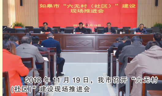
2018年11月19日，我市召开“六无村（社区）”建设现场推进会