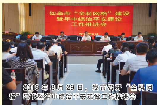
2018年8月29日，我市召开“全科网格”建设暨年中综治平安建设工作推进会

四是督查考核确保履职到位。加强调研督查推动的力度，对法院、法制办、法宣办、发改委、市场监管局、教育局、卫计委等法治建设重点部门进行调研；组织开展法治基层基础建设专项督查，通报整改存在问题，下发法治建设提示函8次；大力开展基层法治系列创建活动，在搬经镇召开全市基层法治“五大板块”系列创建现场推进会；对全市14个镇（区、街道）履行法治建设第一责任人履职情况进行专项督查，下发督查通报，推动党政主要负责人履职到位。