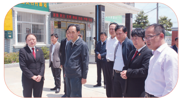
2018年5月9日，南通市委常委、政法委书记姜永华来如调研基层政法工作