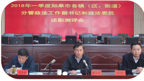
2018年4月24日，我市召开各镇（区、街道）分管政法工作副书记和政法委员一季度述职测评会