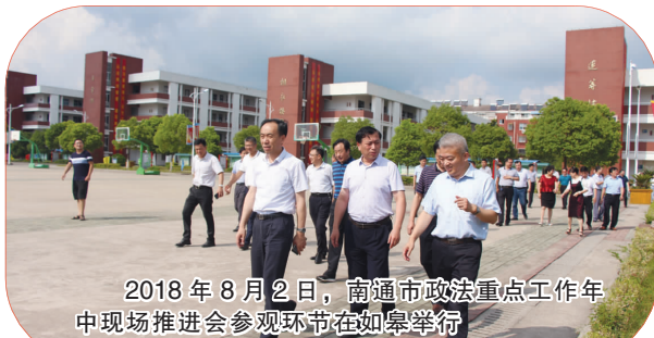
2018年8月2日，南通市政法重点工作年中现场推进会在如皋举行