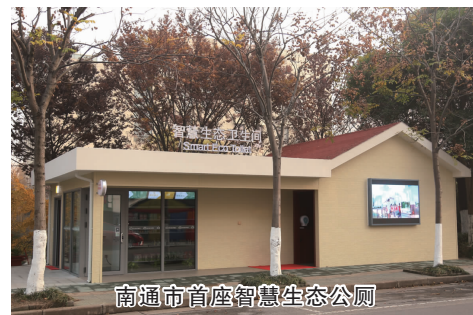
南通市首座智慧生态公厕