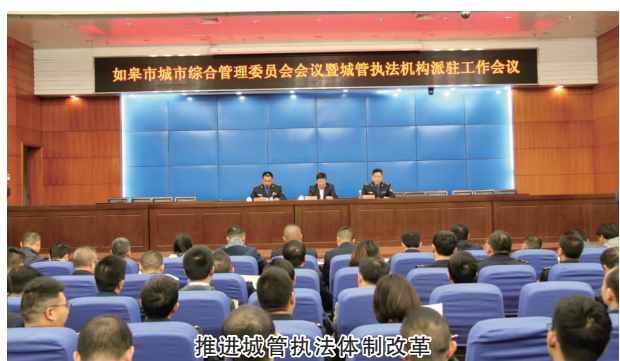
推进城管执法体制改革

与此同时，如皋城管既针对创成的示范社区、示范路、示范物业管理项目常态化开展“回头看”，又以这些示范路、小区为标杆，以点带面，厚植创建优势，形成辐射效应；针对常反弹、易反复的城市顽疾，落实切实可行的“防回潮”机制，市容秩序专项整治行动全面落实全行业覆盖、全时段管理、全流程控制。2018年，如皋城管共开展市容秩序和食品流动摊贩整治68次，规范店外占道经营4117起、流动经营5845起；拆除楼顶广告21块、高立柱广告16座，有效缓解了流动摊点、占道经营、店外经营、城市牛皮癣等“城市病”带来的城市压力。