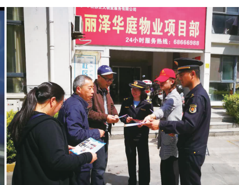
打造“城管+志愿者”管理网格