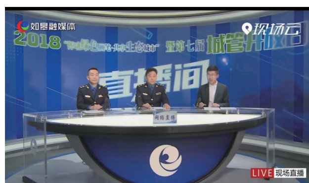
第七届城管开放日现场直播

面对时代带来的挑战与机遇，如皋城管坚定信念，匠心独运，以精细化、智慧化护航城市管理工作，以人本化、多元化追求城市治理效果，这也是新时代城市管理工作走向精细化的有益实践与必要尝试。只有政府、社会、市民同向发力，才能织就“幸福蓝图”。当城市管理给生活带来更多便利，更多的便利也成为城市管理发展的强劲动力，鞭策着城市管理恪守匠心、推陈出新！