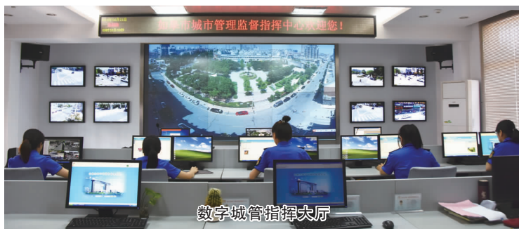
数字城管指挥大厅

市城管局大力推进“智慧城管”建设和“微治理”工作，助力城市管理由管理型向服务型、单一型向互动型、“小城管”向“大城管”的转变。