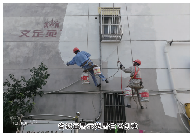
省级宜居示范居住区创建

在推进城管执法体制改革的同时，如皋城管以务实重行回应人民群众的期许，大力推进城市环境综合整治，卓有成效地开展垃圾分类治理、违法建设治理、生态环境治理、老旧小区改造等惠民工程，着力解决生活垃圾分类“走过场”，建筑垃圾资源化利用“摆样子”等突出问题，不断提升城市治理能力与服务水平。