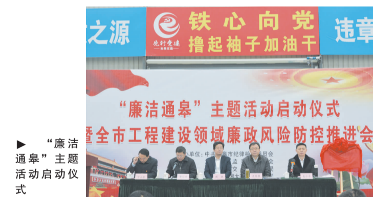
“廉洁通皋”主题活动启动仪式