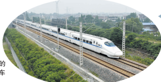
▶ 营运中的宁启铁路动车