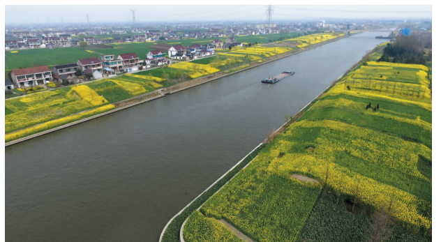
连申线如皋段航道

2018年，市交通运输局认真贯彻落实市委、市政府和南通市交通运输局的各项决策部署，开拓思路应对各种挑战，凝心聚力推动交通工程建设，创新品牌狠抓党风廉政建设，交通事业呈现出良好的发展态势。