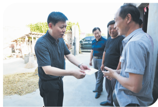
“走帮服”工作深入推进