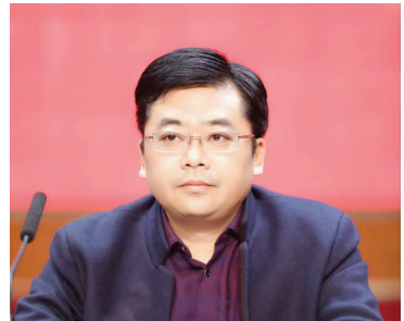
市教育局局长 党委书记 张俊