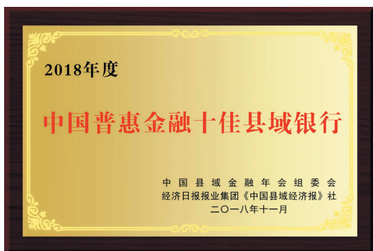
▲ 中国普惠金融十佳县域银行