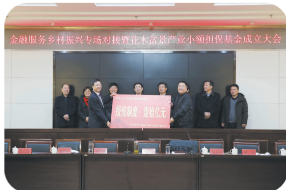
▲ 助力花木盆景产业小额担保基金成立