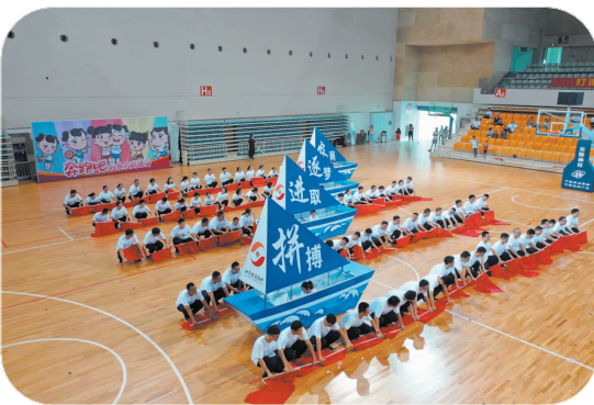
▲ 第五届职工运动会开幕式