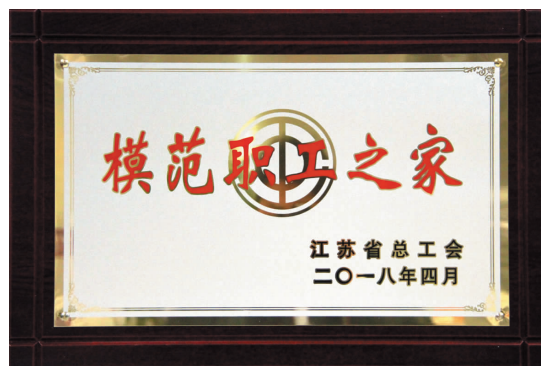
▲ 江苏省模范职工之家