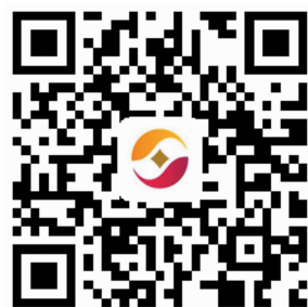
拍摄于2018年12月 视·频·导·视

回眸2018，有太多感动与故事，这一年，我们用汗水追逐梦想，这一年，我们收获感动与成长。“幸福都是奋斗出来的！”2019，有更多期待和希望，我们将不忘“服务三农”的初心和使命，打造苏中地区最佳农商银行！