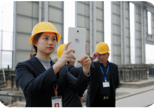
▲ 开展“千金百化”工程，支持实体经济发展