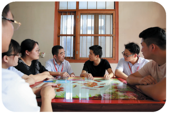
▲ 开展“整村授信”走访农户