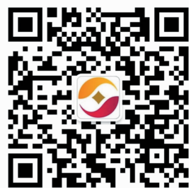
扫一扫关注 如皋农商银行

回眸2018，有太多感动与故事，这一年，我们用汗水追逐梦想，这一年，我们收获感动与成长。“幸福都是奋斗出来的！”2019，有更多期待和希望，我们将不忘“服务三农”的初心和使命，打造苏中地区最佳农商银行！