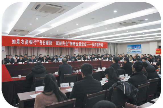
▲ 开展“冬日暖阳 赋能民企”走进民营企业活动