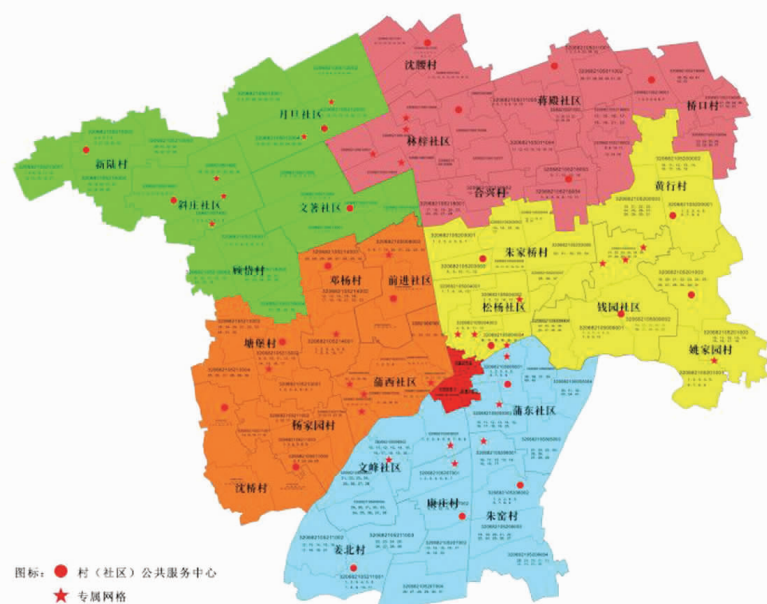
白蒲镇全科网格建设平面图

织网： 强化顶层设计 因地制宜划分网格 白蒲镇总面积 144.89 平方公里，总人口 12.31 万人，辖 26 个村（社区）、3 个城市社区。在实行网格化服务管理之初，白蒲镇围绕夯实综合治理基层基础，创新“智慧平台+全科网格”治理模式，将现代化信息支撑与网格化社会治理相结合。在全镇划分 112 个一般网格，35 个专属网格，配备网格员 139 人，专兼职网格员信息员 863 人，专职网格员 27 人。 新陆村共 38 个组，划分为 4 个网格区，网格队伍也择优择强，并且将村民组长统一进行了网格服务培训，网格服务人员分为了网格长、网格管理员、网格信息员，为此，新陆村配置了综合文化服务中心、法律顾问、综治巡查队伍、村民调解委员会等，提升了网格服务管理工作水平。 管网： 加强网格培训 创新网格宣传方式 在全面推进网格化服务管理过程中，为建强村级网格队伍，让网格员