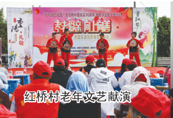
红桥村老年文艺献演