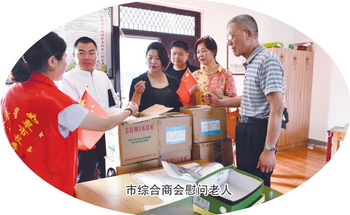
市综合商会慰问老人