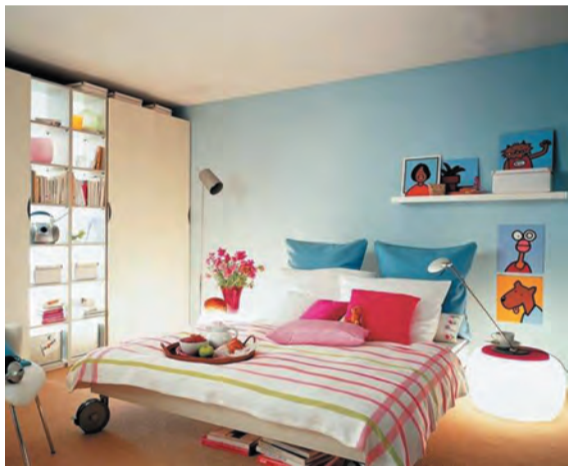
床头设计搁架,便于放置日常所用物品,还可以展示照片,美感又有温暖感。

床头背景墙是可以好好布置和利用的地方,带纹理的壁纸、装饰画、挂饰、搁架等创意奇特的设计,都能让此处小景即刻成为抢眼而别具情调的细节空间。让卧室既实用又漂亮。