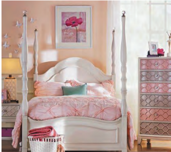
优雅粉和高雅灰与珍珠白搭配使用,提升卧室的优雅感与品质感。装饰画及小物点缀,让床头背景墙更有立体感。