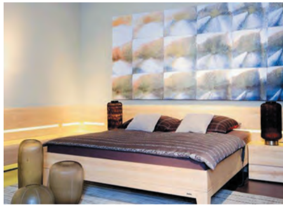
看似简单的卧室布置,床头如此设计,便有了韵味。