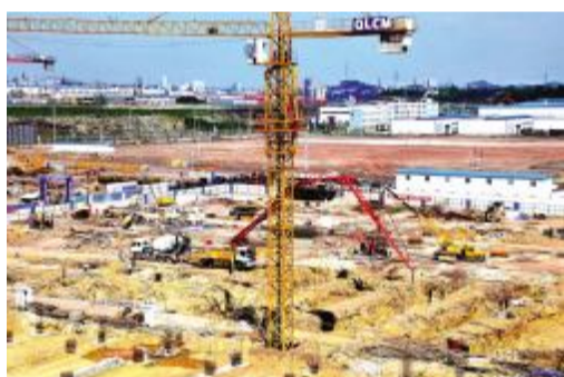
聚焦“城西组团”重大项目

同时,在强化项目推动上实现新突破,做好园区承载能力的提升、主导产业培育和工业重点项目建设;在强化招商引资上实现新突破,实施产业链招商,做大做强电子信息、机械汽配和生物医药“三大产业”,重点引进世界500强、国内龙头企业等投资项目,多引进总部经济、富税、高强度投资和高新技术企业;在强化融资开发上实现新突破,创新土地整理、项目招商和申请企业债券等融资方式,全力构建“以商补工”机制,把兴元公司打造成为优质融资平台;在强化体制改革上实现新的突破,坚持“小政府、大社会”和“小机构、大服务”的原则,要按照“精简、统一、效能”的原则设置机构,切实做到“授权到位、责任明确、封闭管理、开放运行”。