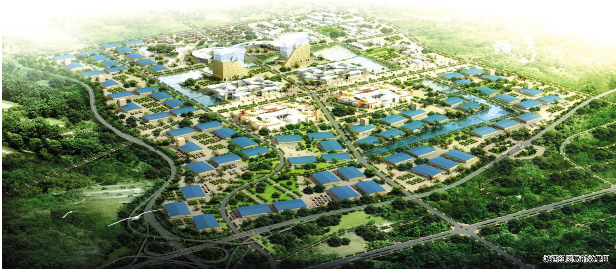
城西组团局部效果图

今年,内江经开区将总投资67亿元,建设12个重大项目,包含巨腾国际、华润啤酒、欧盟标准抗癌制剂等大型工业项目,中国家居商贸城、川南汽贸城等商贸项目,污水处理厂、道路建设等基础设施项目和安置还房等民生工程。通过这些大项目,园区今年将力争建成百亿工业园区,成为内江新城发展的重要引擎。