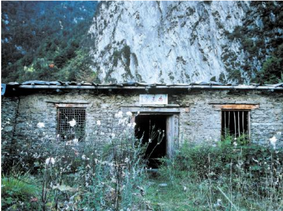
理县通化乡传说中的大禹遗迹禹王宫