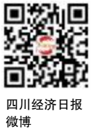
四川经济日报 微博

更多精彩内容请关注四川经济日报微信公众号和微博,欢迎和我们的话题#川行无边##地球是圆的#互动。