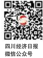
四川经济日报 微信公众号