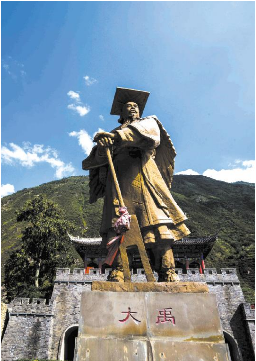
大禹雕像

大禹是中华民族的人文共祖之一,自古以来,大禹的传说不但在汉族地区流传甚广,也一直受到羌族人民的崇拜。大禹所在的古羌部落,被帝尧征召治水,大禹接替治水失败的父亲鲧后,历时十三年,最终完成治水大业。自此以后,中原地区成为适合农耕的沃土,华夏文明从此进入繁荣发展的时期。