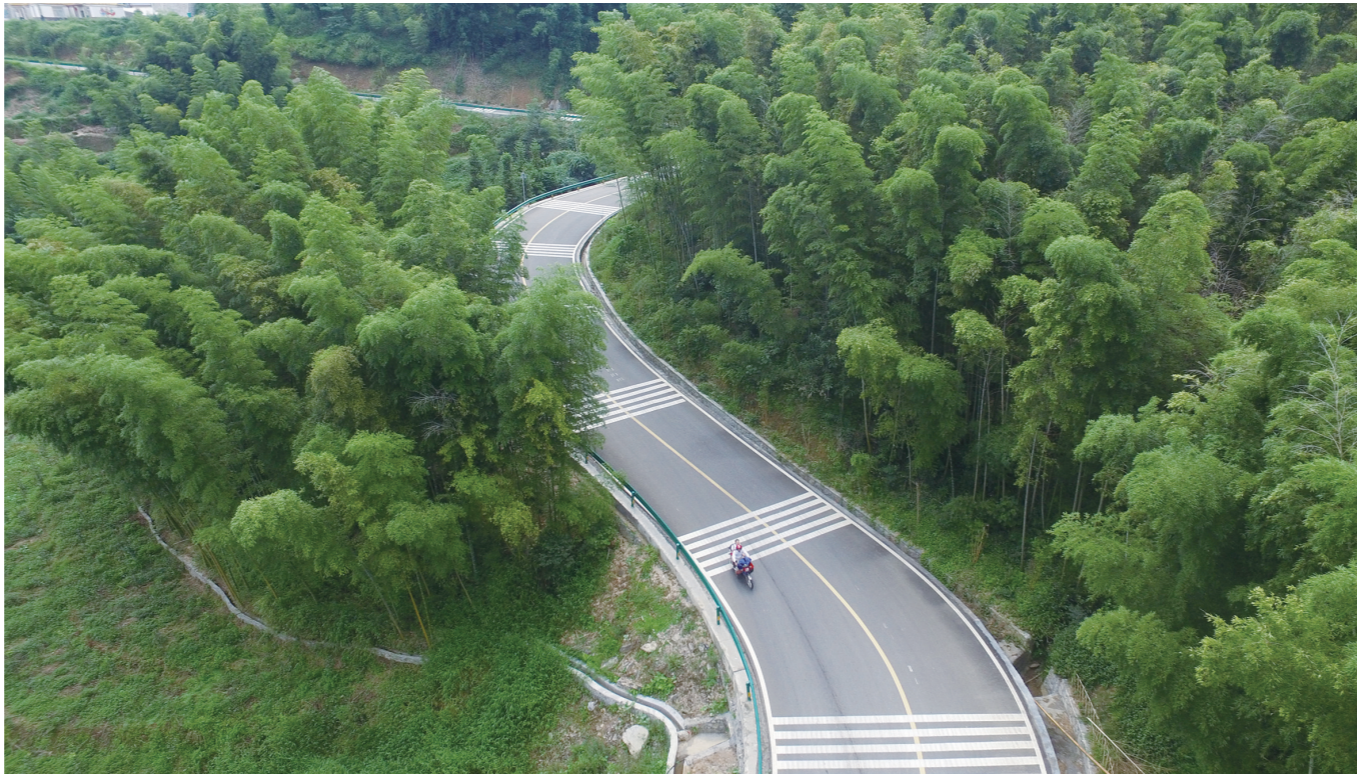
公路沿线的竹景观

最新出台的《兴文县关于加快竹产业发展的实施意见》确立了“楠竹要稳,杂竹要扩,方竹要推,林下多元”的发展思路,鼓励发展竹下经济、发展以竹为主题的生态康养旅游产业等,力争2022年建成全省竹产业重点县。