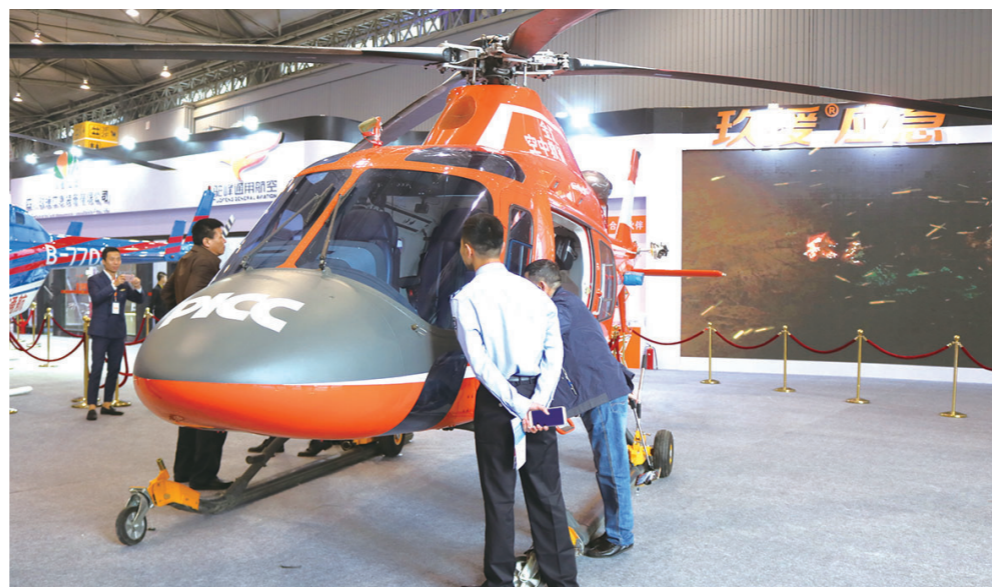
“空中救援救援应急组团”的救援直升机

同时,为满足市场创新和信息化提升的需求,救援应急未来也将与优秀高校和科研机构合作组建应急技术研发转化平台,培育适应市场的高科技应急装备,并在政策的牵引和市场供需的带动下,大力推动应急技术、应急装备和应急服务的输出和应用。