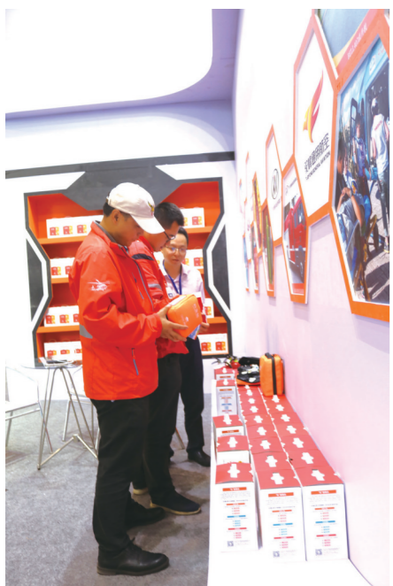
参观观众了解消防设备