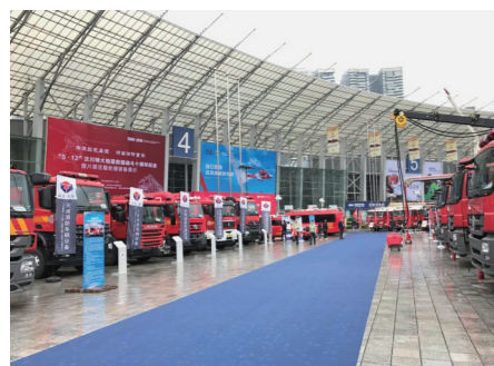
场外展示的消防车