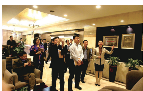
2016年国家旅游局对汇东大酒店进行文化主题酒店试评工作