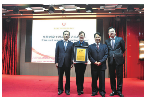
2015年荣获最佳主题旅游饭店