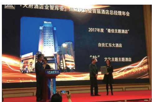
荣获2017年度最佳主题酒店