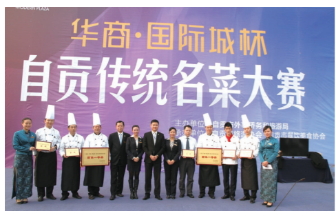
2015年酒店在自贡参加自贡传统名菜大赛