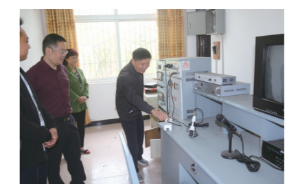
旌阳区文广局领导指导广播电视发展

四川经济日报(陈涛 记者 钟正有)今年以来,德阳市旌阳区文广局通过定基调、强宣传、建队伍等举措力争让全区建档立卡贫困户都看上优质电视节目,享受广电发展成果,将广电扶贫惠民工作引向深入。