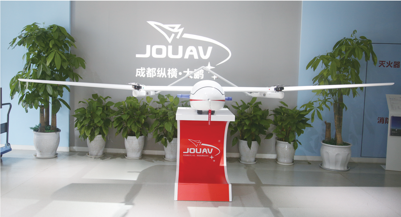
成都纵横大鹏无人机

提到谍战电影007,你会想到什么?詹姆斯·邦德使用过的令人眼花缭乱的“黑科技”让人记忆尤深。