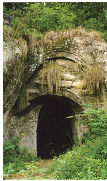
禹迹古堡之中寨门