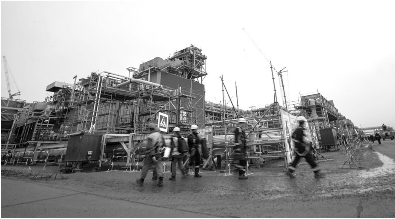
这是8月8日在俄罗斯萨别塔塔拍摄的正在建设中的中俄亚马尔项目第三条生产线。

路的黄金法则，决定了“一带一路”合作具有鲜明的平等性、开放性和普惠性。“一带一路”不是中国一家的独奏，而是沿线国家的合唱；不是私家小路，而是携手前进的阳光大道。作为平等的参与者、贡献者和受益者，各国建设“一带一路”的热情得到充分释放，共享优势互补、互学互鉴的发展机遇。在逆全球化思潮泛起，单边主义、保护主义不断抬头的当下，“一带一路”的开放胸襟、合作精神更加显得难能可贵，被国际