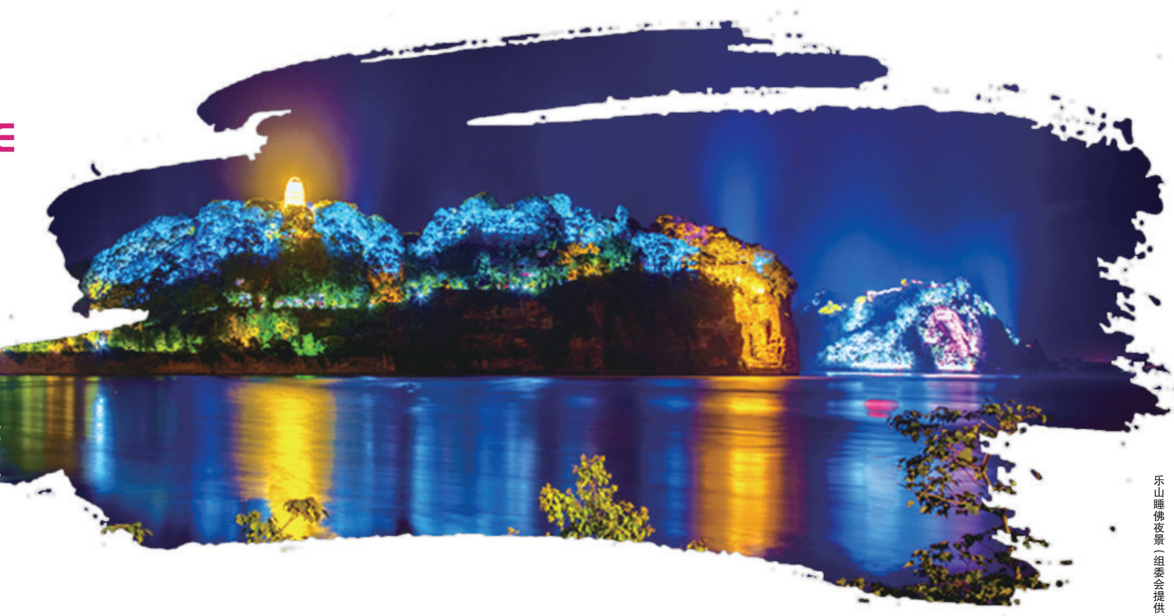
乐山睡佛夜景