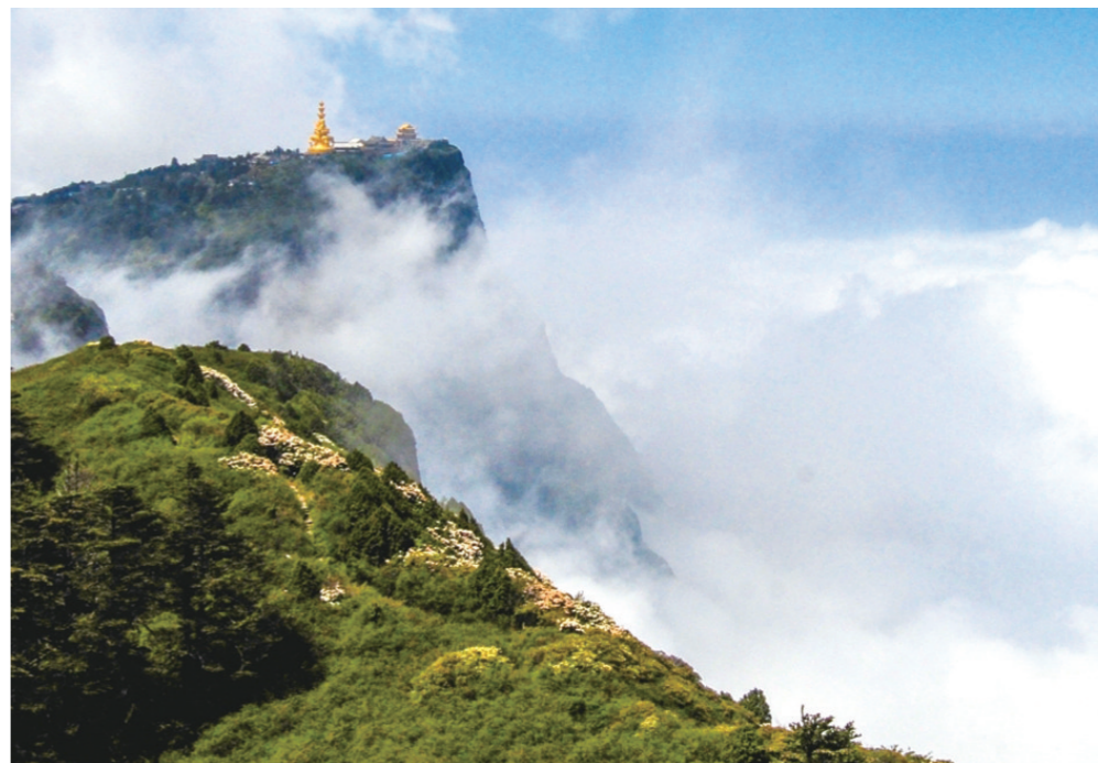
峨眉山雄姿