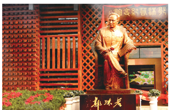
郭沫若纪念馆