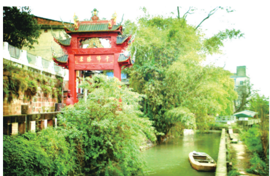
夹江东风堰