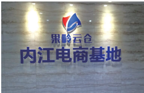
“果岭云仓”内江电商基地