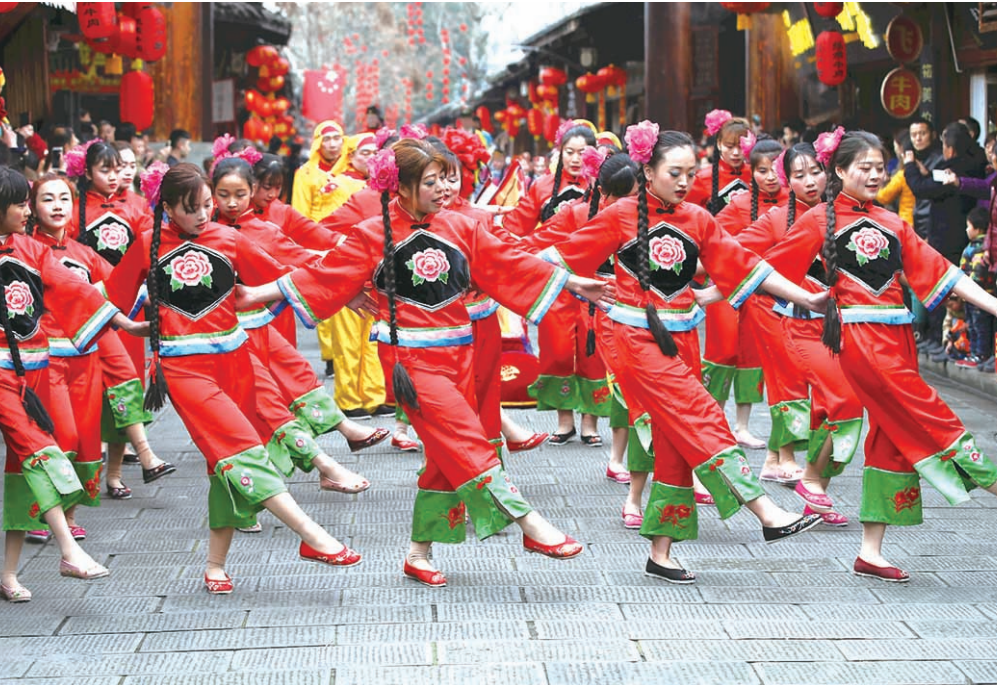
民俗表演中的亮花鞋

阆中当地也把这靓丽的民俗活动引入古城的旅游文化中,并在游客面前表演,成为阆中又一张靓丽的名片。这些年来,春节期间到阆中旅游、体验阆中独特民俗的游客络绎不绝。阆中作为“中国春节文化之乡”的美誉,远播四方。