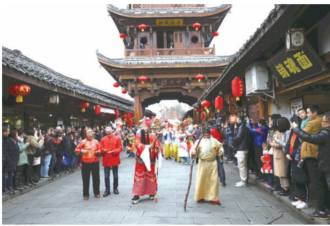
民俗活动中的春官说春

同时,阆中因为是春节的发源地,所以春节的开始结束日期也与周边有所不同;阆中进入春节程序,传统上是从腊月初八吃腊八粥开始。腊八这天,阆中古城四条街道年味十足,吃腊八粥的人群川流不息,腊八粥一共摆100多桌,场面宏大。而阆中春节的结束则要到农历的二月初二,以妇女们“亮花鞋”这种方式,来向春节道再见。