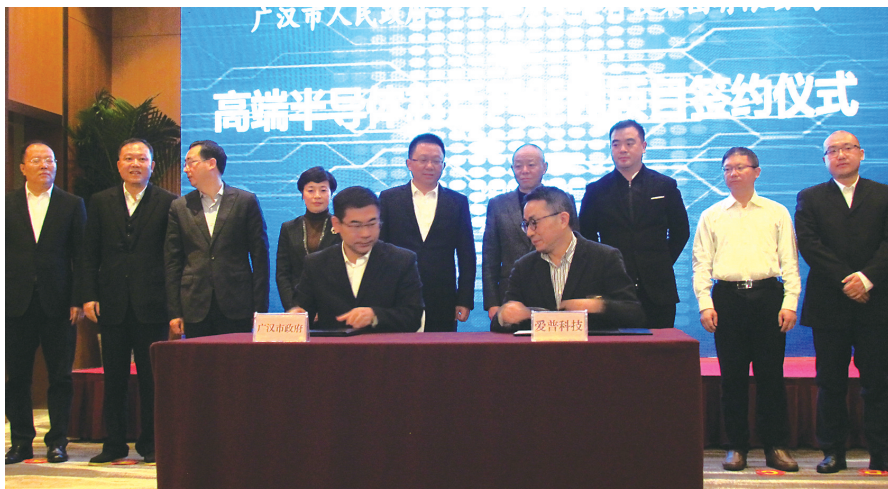
德阳市委书记赵世勇(后排左5)参加重大工业项目签约仪式