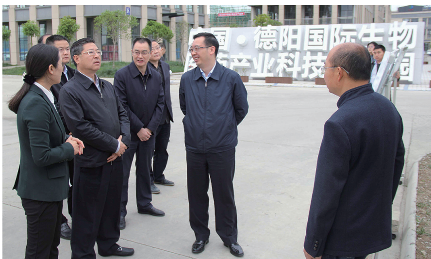
德阳市人民政府市长何礼(前排左2)调研九为蓝谷产业园