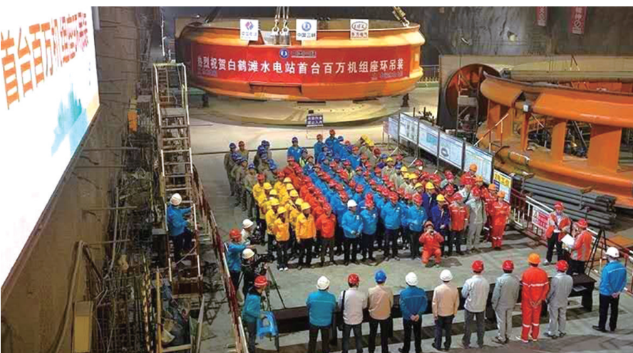
东方电机生产的白鹤滩水电站首台百万机组座环吊装成功

行业经济运行,多形式开展基层调研,出台加强稳增长政策、措施。着力金融协同,提升金融服务实体经济能力,深化金融体制改革,创新优质金融服务产品。