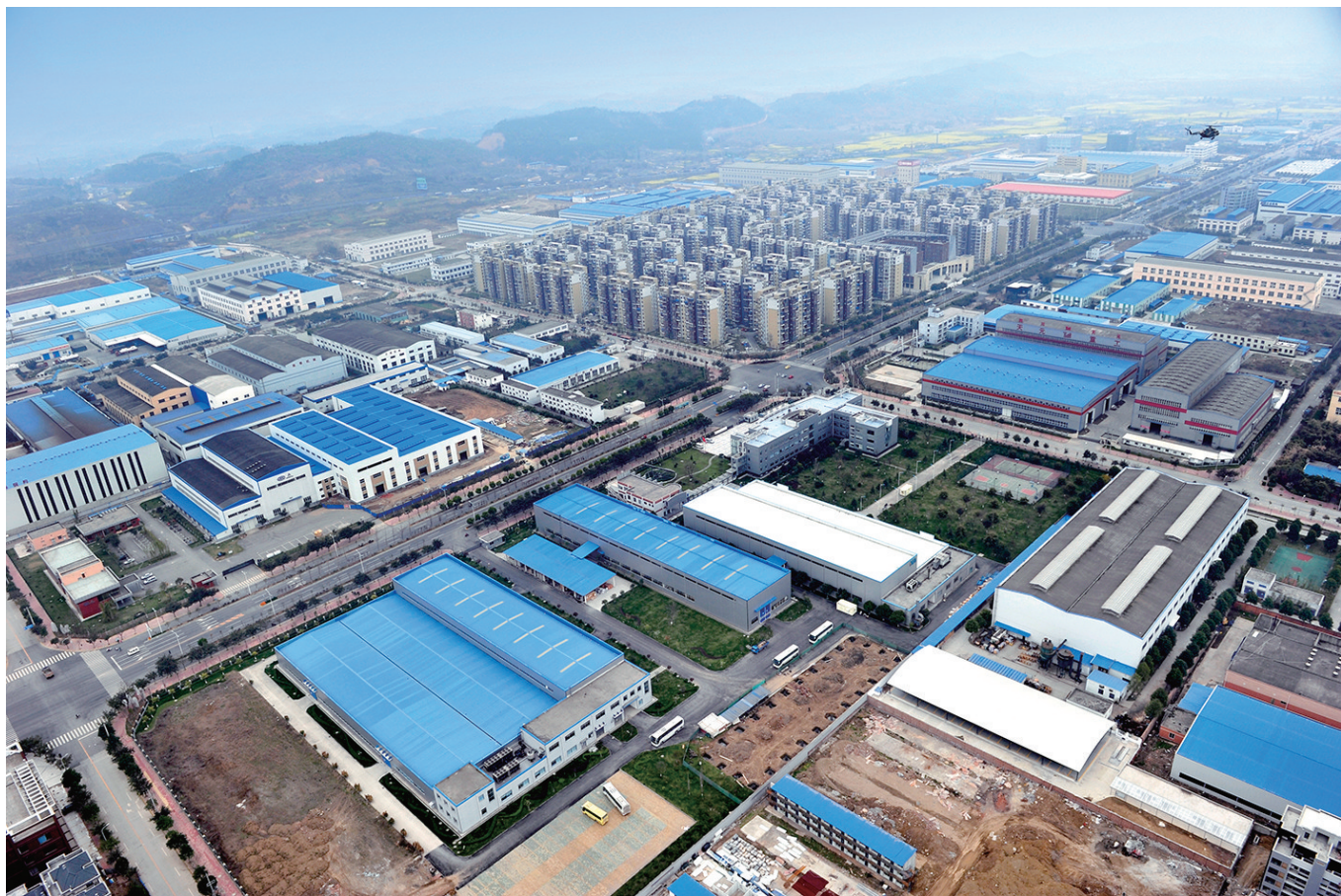
德阳经开区工业园区全景图

新的一年,德阳工业勇挑大梁,牢牢把握推动制造业高质量发展这一关键,变中求新、变中求进、变中突破,“装备智造之都”迎来工业发展的又一个春天。